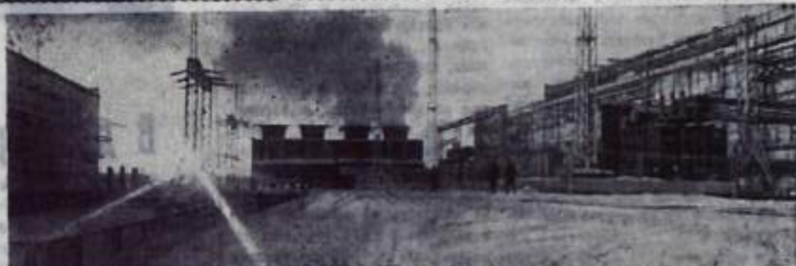
ЯКУТСК. Там, где до недавнего времени был пустырь, встает корпус Якутской ГРЭС. Здесь действуют три энергоблока, заканчивается монтаж четвертой машины. С вводом ее в эксплуатацию мощность ГРЭС достигнет нескольких десятков тысяч киловатт. Это — единственная в стране станция, работающая на двух видах топлива — жидком и газе. Опыт строительства и эксплуатации Якутской ГРЭС будет использован при проектировании подобных объектов в условиях вечной мерзлоты.