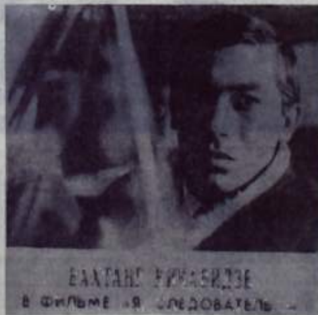
БАХАТУН КИКАБИДЗЕ В ФИЛЬМЕ «Я СЛЕДОВАТЕЛЬ»

Ранним осенним утром жители Пассанаури обнаружили в придорожном кустарнике тяжело раненого молодого человека. Не приходя в сознание, он умер.