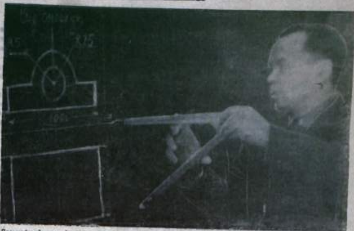
Восьмой год в городской школе-интернате им. Ю. Гагарина функционирует кабинет черчения и рисования. Учащиеся здесь предоставлены все условия для успешных занятий: различные чертежные инструменты, фильмоскоп с набором киноленок и другие приборы.

преподаватель продленной группы учащихся школы № 1.