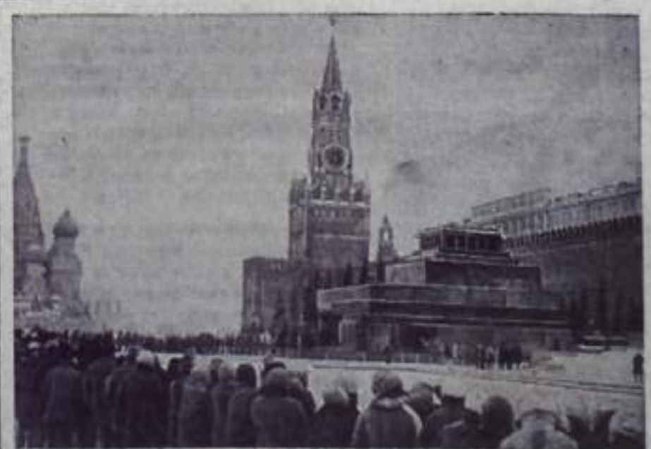
МОСКВА. Красная площадь. Мавзолой В. И. Ленина. Январь 1972 года.

Обязательства обсуждены и приняты на собрании партийно-хозяйственного актива города и района.