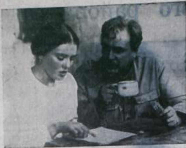
На снимке: кадр из фильма. Анна — артистка Ж. Прохоренко, Арсений — артист Е. Матвеев.

Фильм показывает жизнь одной из первых коммун, организованных бедняками в первые годы становления Советской власти на Дону. Драматические эпизоды непримиримой классовой борьбы, общественные конфликты переплетаются с личной драмой героев. Одна из важнейших в фильме тем — раскрепощение женщины.