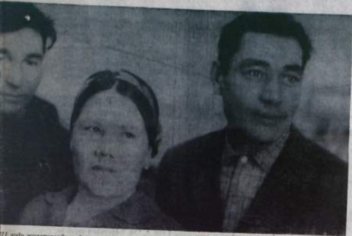
В 1971 году животноводы отделения «Урник» района развернули социалистическое соревнование по плану девятой пятилетки, она достигла показателей в совхозе по надоям молока: по 2881 кг молока. А дойный гурт, ко-