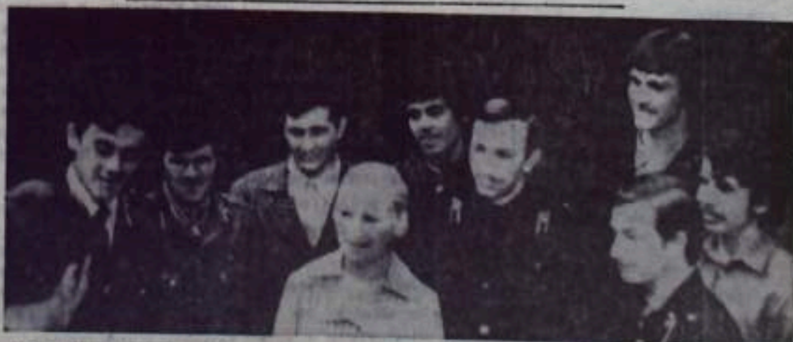
На снимке: участники слета дружинников, члены комсомольского оперативного отряда горкома ВЛКСМ.

С. ШАГИН, главный зоотехник сельхозуправления.