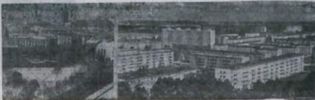
Столица Эстонской ССР — город Таллин. Справа — новый жилой район — Мустамяэ.

*В 1976 году было выдано 2256 книг общим тиражом 17 миллионов 765 тысяч экземпляров против 266 книг общим тиражом 2 миллиона 126 тысяч экземпляров, выданных в 1940 году.