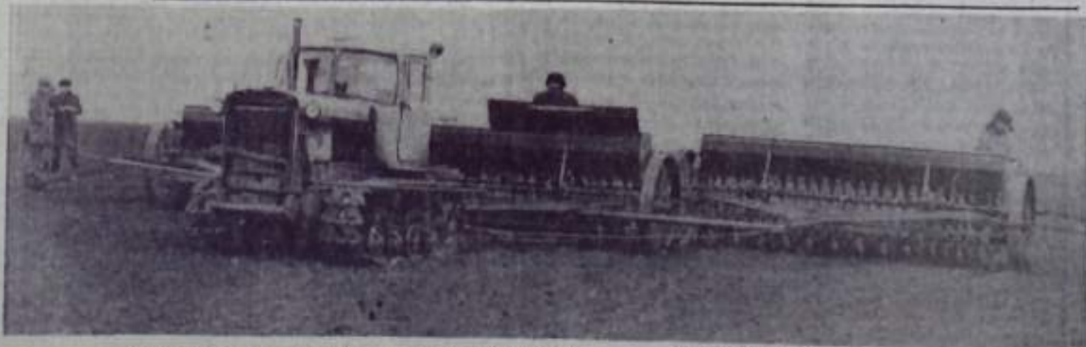
На снимке: идет сев зерновых в колхозе имени Кирова.