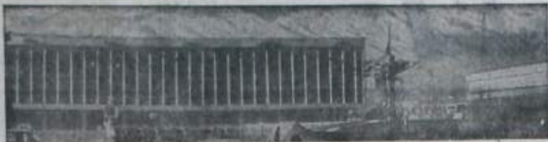
Ашхабад—столица Туркменской ССР.

НА СНИМКЕ: здание крупнейшей в городе библиотеки имени Карла Маркса.