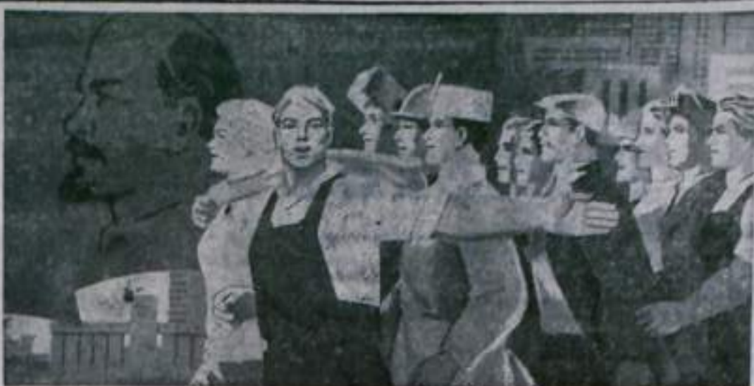
Планат художника И. Коми- нарца. Издательство «Планат».

Дать Ильича Издается с 1956 г. ПРОЛЕТАРИИ ВСЕХ СТРАН, СОЕДИНЯЙТЕСЬ!