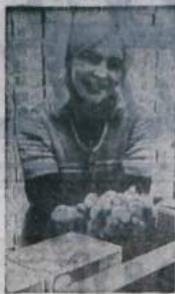
Ленинградская область. Самой большой урожай — около 1400 тонн овощей — получила в нынешнем году коллектив ленинградского объединения «Лето». Эта первая в стране специализированная фирма по выращиванию ово-

В результате не все хозяйства и школы района имеют надлежащий спортивный инвентарь и оборудование, что несомненно, сказывается на уровне спортивно-оздоровительных мероприятий.