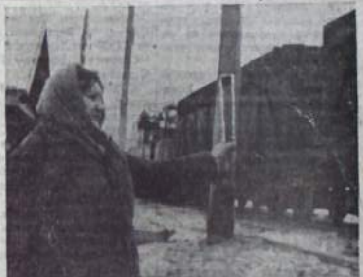
Вот уже три месяца, как функционирует новый железнодорожный пост «Рыбная» на угольном разрезе. Практика показала, что отличная от прежней схема развития путей делает возможным принимать угольные вертушки под погрузку в вагон, осуществлять обгон и скрещивание поездов, производить маневренные работы. Эти преимущества позволяют значительно уменьшить время на обмен вертушек, а значит, сократить оборот вагонов и простой экскаваторов. Кроме того, удобная схема путевого развития поста даст возможность при сговаривании порожних вертушек в отвал обойтись без дополнительных маневров, чего не было предусмотрено в прежней схеме.

С заключительным словом выступил заместитель Председателя Совета Министров СССР председатель Госплана СССР депутат Н. К. Байбаков.