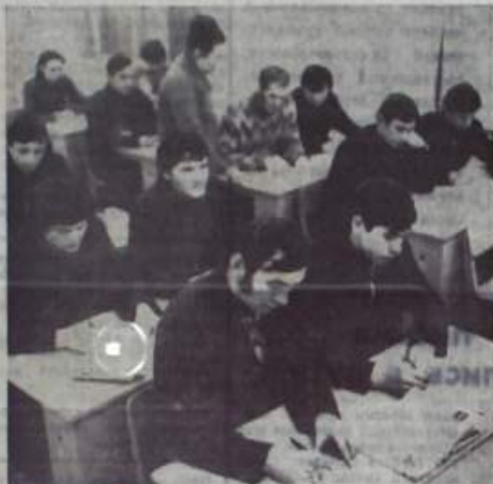
На снимке: идут занятия в вечерней школе рабочей молодежи.