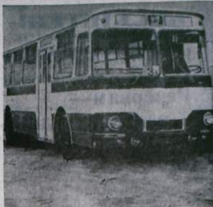
Недавно на городских маршрутах появились новые автобусы марки ЛИАЗ-677, партия которых прибыла в автоколону № 1832 с Ликинского автозавода. Конструкторы машины предусмотрели максимум удобства для пассажиров: широкие двери, обогреваемый салон на пневматической подушке, который вмещает более 100 человек. Созданы удобства и для водителей — у автобуса автоматическое переключение передач.