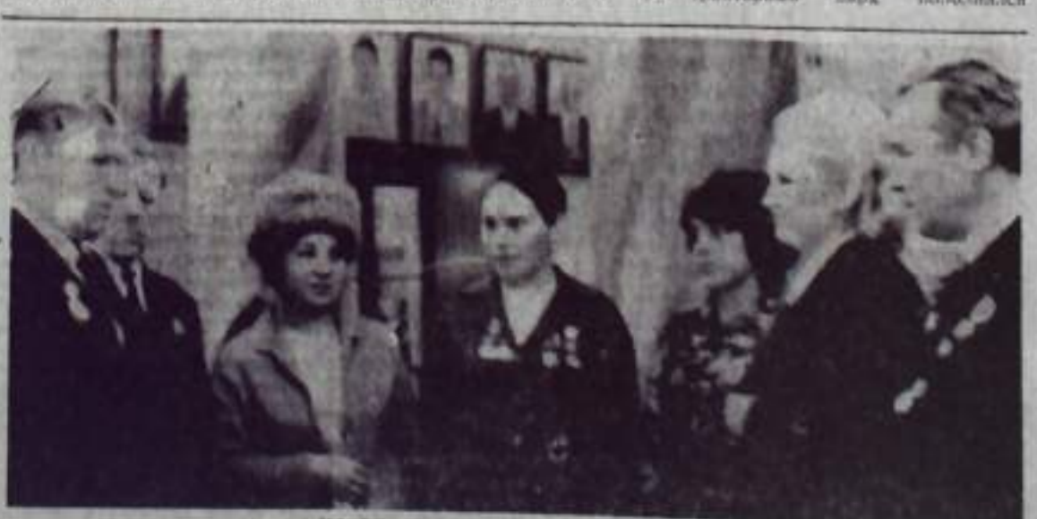
НА СНИМКЕ: группа делегатов конференции.

На полях колхозов и совхозов района работают 731 трактор, 363 автомобиля и 364 зерновых комбайна и много другой сельскохозяйственной техники. Машинотракторный парк пополняется