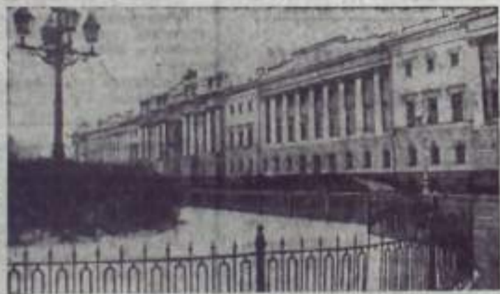
На снимке: бывшая Сенатская площадь, ныне площадь Декабристов в Ленинграде, где в декабре 1825 года произошло восстание.