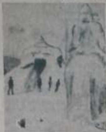
На горальной площадке на склоне Нового года.