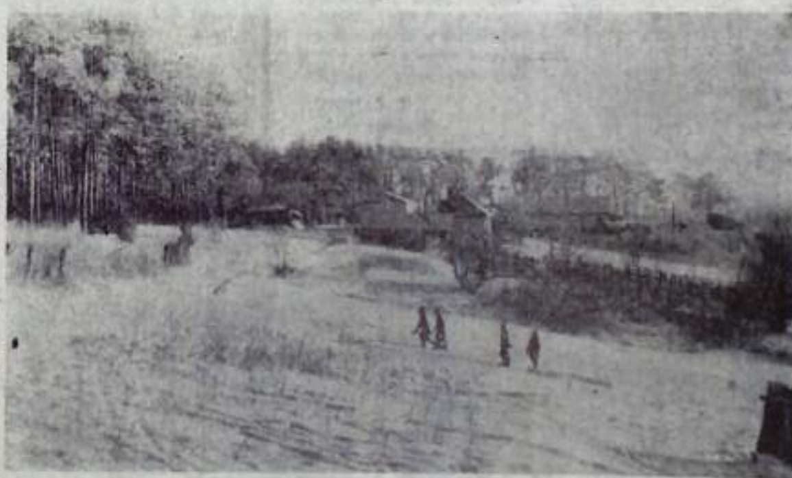
Редактор Э. Ю. ТАГИРОВ.