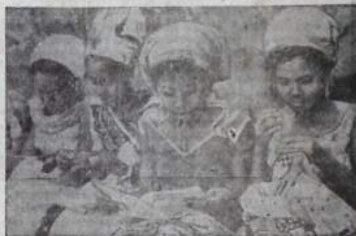
Правительство Социалистической Демократической Республики прилагает большие усилия для ликвидации неграмотности, развития системы образования. В стране введено обязательное начальное образование, повсеместно расширяется сеть профессиональных училищ и средних школ.