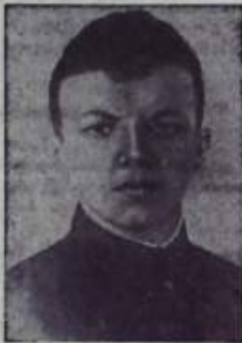
А. М. МАТРОСОВ (К 50-летию со дня рождения)

Олицетворением пламенного патриотизма советских людей, их беспримерного подвига во имя Родины навсегда останется Великая Отечественная война. Миллионы советских воинов совершили героические подвиги. Среди них и гвардии рядовой комсомолец Александр Матросов (1924—1943). 23 февраля 1943 года, в День Красной Армии, в бою за деревню Чернушки Великолукской области на Калининском фронте Матросов закрыл своим телом амбразуру вражеского дота, чем обеспечил наступление своего подразделения. Ценой собственной жизни отважный воин-комсомолец спас сотни людей и помог успешному решению боевой задачи. Александру Матросову было всего 19 лет. Родина высоко оценила бессмертный подвиг вана-гвардейца. Воспитаннику Ленинского комсомола А. М. Матросову было посмертно присвоено звание Героя Советского Союза.