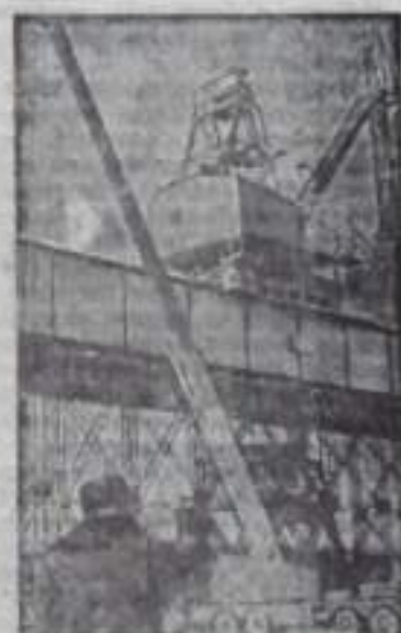
ПРИМОРСКИЙ КРАЙ. На берегу бухты Врангеля открыт новый глубоководный порт Восточный В эксплуатации стал специализированный причал, названный в честь первой очереди порта. В ее комплексе войдут причалы по перевалке технологической древесной щепы и контейнерный, а также уточный причал. Сооружение Восточного имеет большое значение для народного хозяйства. Завершение строительства только первой его очереди, начавшееся в 1970 году, обеспечит перевалку свыше 5 млн тонн грузов в год.