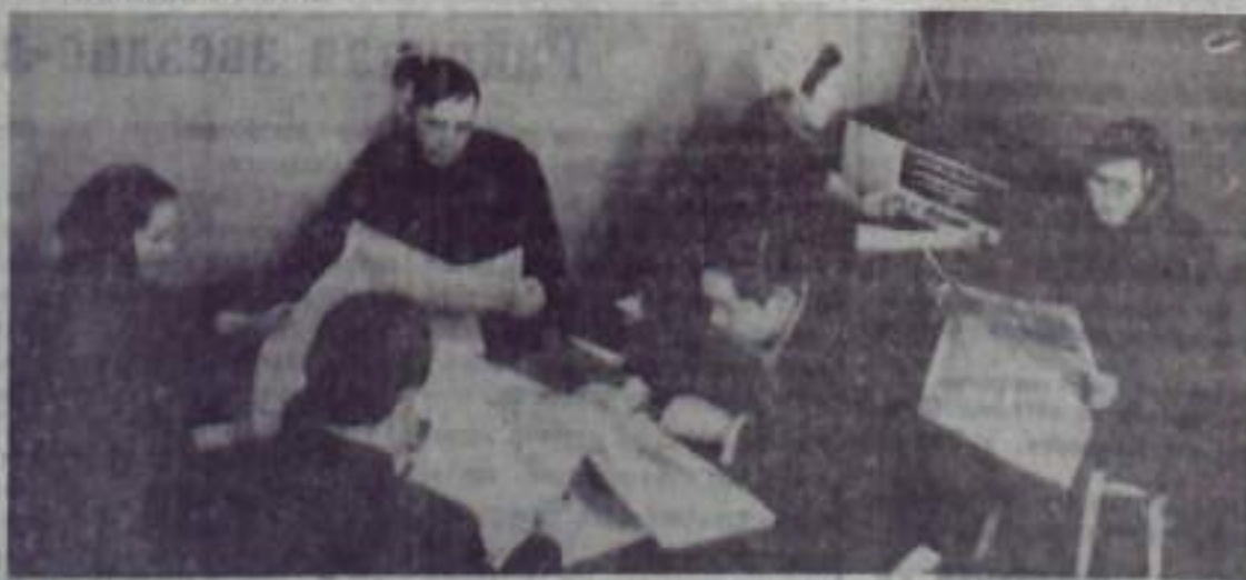
На снимке: в красном уголке МТФ колхоза имени Кирова