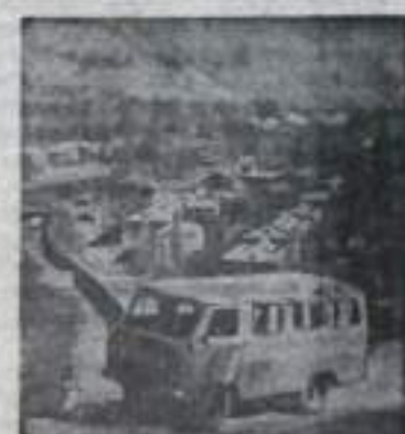
Двадцать семь передвижных библиотек обслуживают многочисленные читатели, живущие в отдаленных кишлаках Горно-Бадахшанской автономной области.