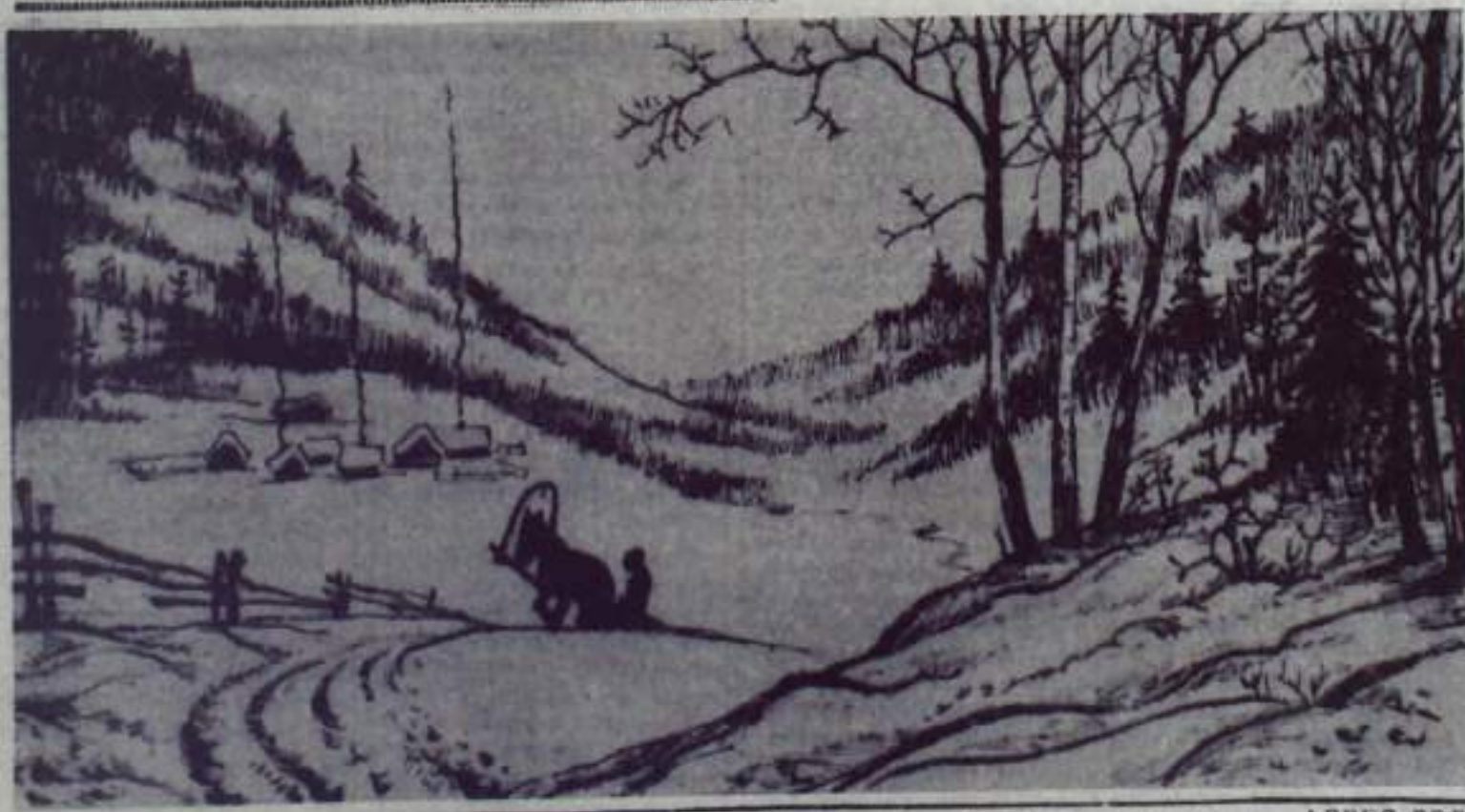
ЗИМНЯЯ КАРТИНА. Рисунок Ю. ЛАРИНА.

Газета выходит три раза в неделю: во вторник, четверг, субботу, на русском и башкирском языках.