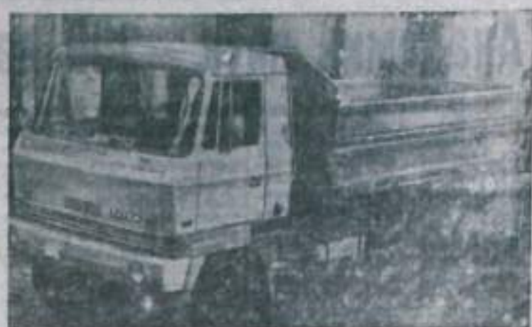
ЧЕХОСЛОВАКИЯ. В пехах опытного завода производят нового объединения «Татра» в Копршивнице собран новый грузовой автомобиль «Т-815» (на снимке). Новый автомобиль несет столько же, сколько выпускаемые сейчас «Татры», однако мощность его двигателя увеличена на 30 процентов, значительно повышены и другие технические параметры.