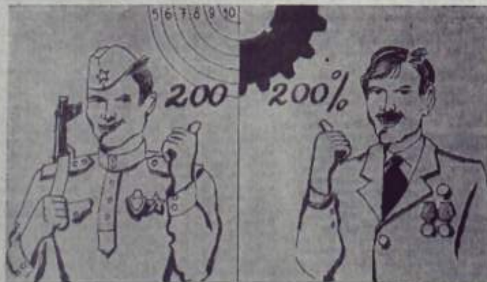
СОЛДАТ ВСЕГДА СОЛДАТ.