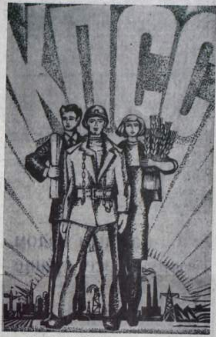
Рис. Р. КАРИМГАЕВА

О том, что Горюнин опы- тный угледобытчик, великоин- дый организатор, на разрезе давно известно. Его бригада одна из лучших в горняцкой семье. Поэтому известно о том, что она стала командиро- ром социалистического сорев- нования за достойную встречу