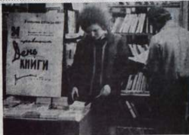
Редактор Э. Ю. ТАГИРОВ.

НА СНИМКЕ: в библиотеке Дворца культуры угольников.