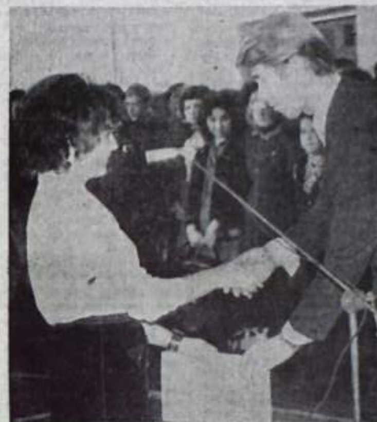
Редактор Э. Ю. ТАГИРОВ .