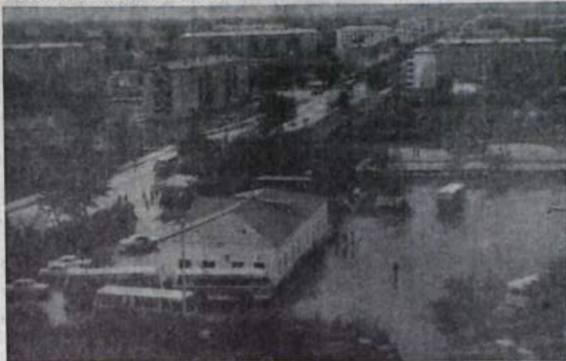
ГОРОД УГОЛЬЩИКОВ СЕГОДНЯ

Небольшой экскурс в историю позволяет сделать удивительные сравнения. В год образования города его промышленными предприятиями было произведено продукции на 6,2 млн. рублей. За 25 лет объем производства продукции увеличился почти в 47 раз. В 23 раза поднялась за четверть века добыча угля, в 27 раз — производство электроэнергии. Более 3,7 млн. тонн бурого угольных брикетов, пользующихся широким спросом, производит брикетная фабрика — крупнейшая среди аналогичных предприятий в стране.