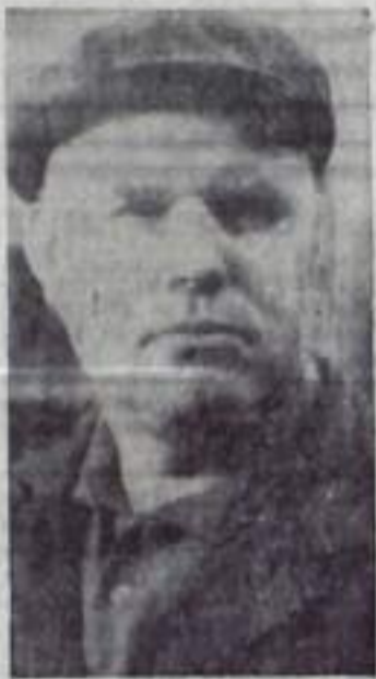
ра, которые ежегодно дают предприятию значительный экономический эффект.

Многие детали предлагаемой на счету рационализатор-