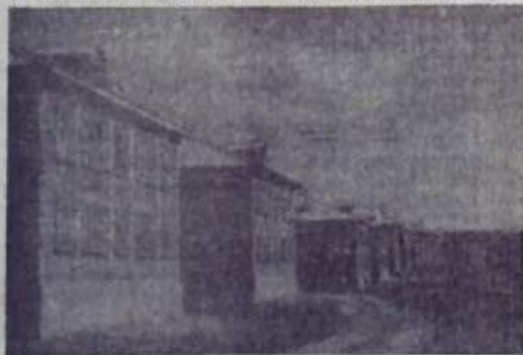
КУМЕРТАУ: НАЧАЛО 50-х ГОЛОВ

Четверть века родного города кумертаусцы отмечают в обстановке высокой трудовой и политической активности, с чувством благодарности КПСС, Советскому правительству за заботу о советских людях, о росте их материального и культурного уровня, повышении благосостояния трудящихся.