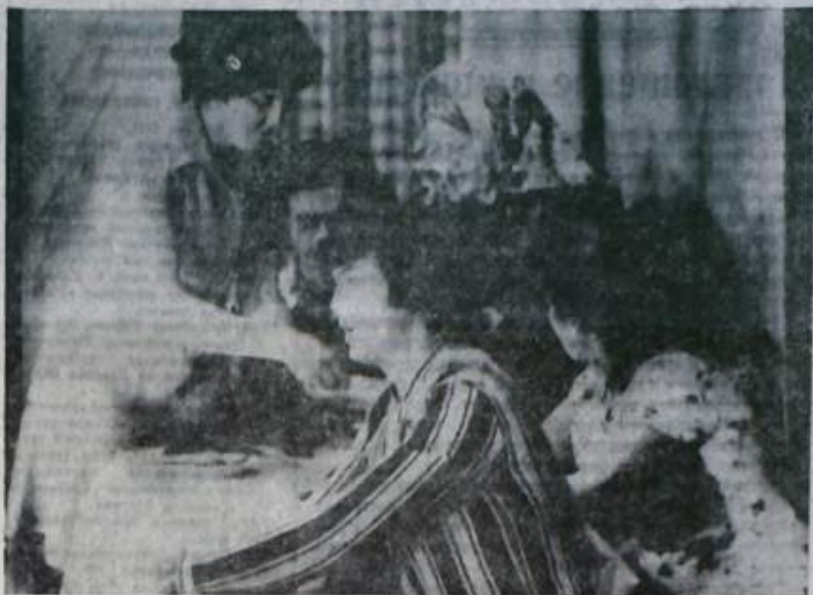
Сцена из спектакля «Седьм волос моей матери».