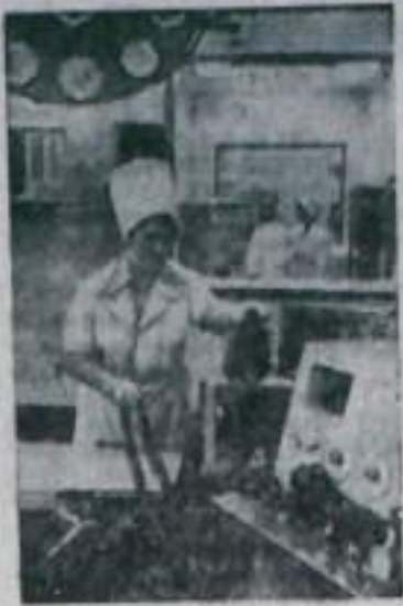
...тические субботников в нашей стране. На снимке: один из новых лечебных блоков онкологического центра; в новой операционной.

тывающий 17 палатных отделений на 850 коек. Строительство онкологического центра (ОНЦ) осуществляется на средства, полученные от Всесоюзного субботника, посвященного 50-летию первых коммуни-