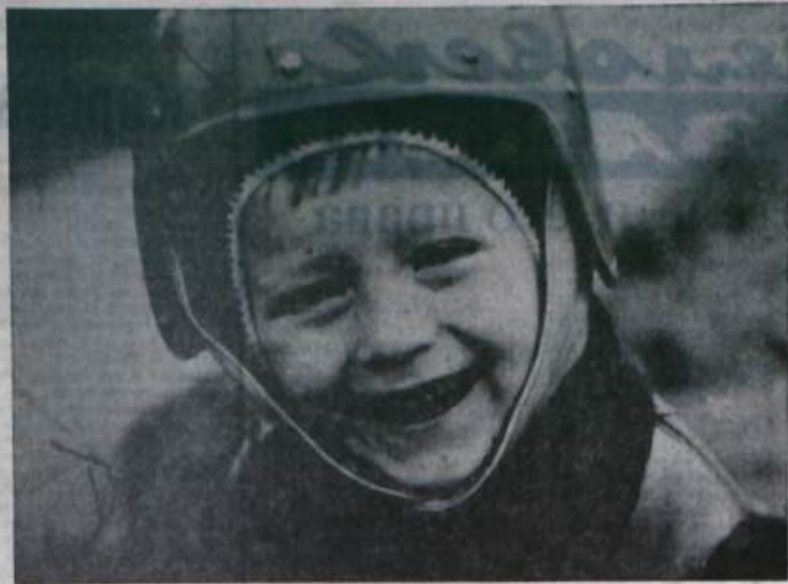
На фотоконкурс «КРАЙ РОДНОЙ».