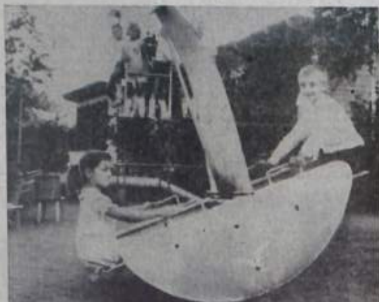
Редактор В. Ю. ТАИРОВ.