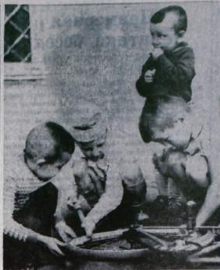
Непредвиденный ремонт.

Пусть запомнят любители, все те, кто без зазрения совести грабит природные богатства,—пощады им не будет.