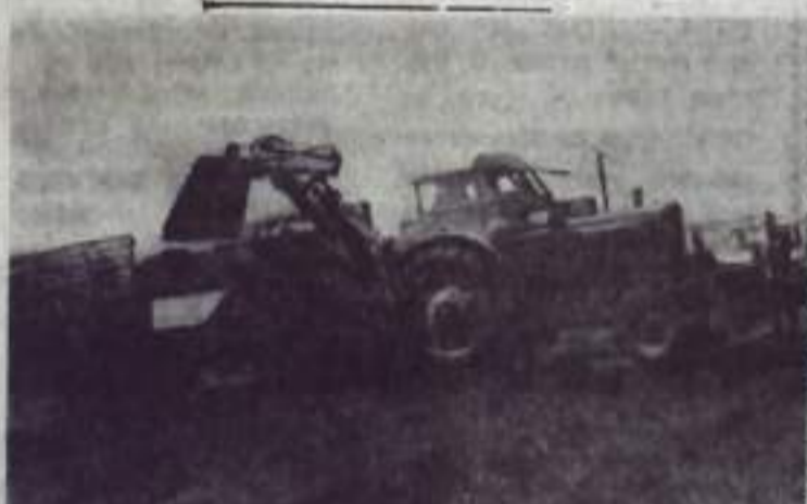
Завозится гравий на участок дороги Уфа — Оренбург.