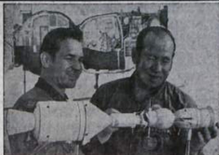
Первый экипаж космического корабля «Союз», участвовавший в совместной программе «Союз — Аполлон», — Алексей Архипович Леонов и Валерий Николаевич Кубасов.