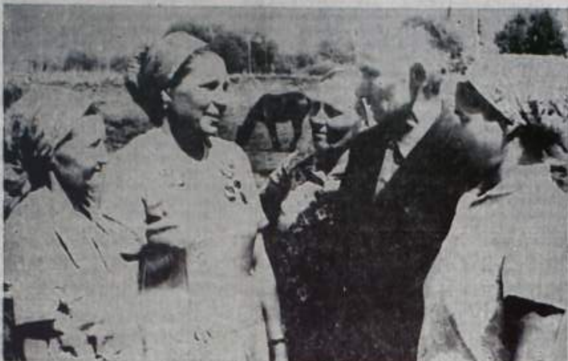
У ПОБЕДИТЕЛЕЙ СОРЕВНОВАНИЯ