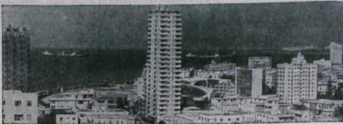
На снимке: столица Кубы Гавана.