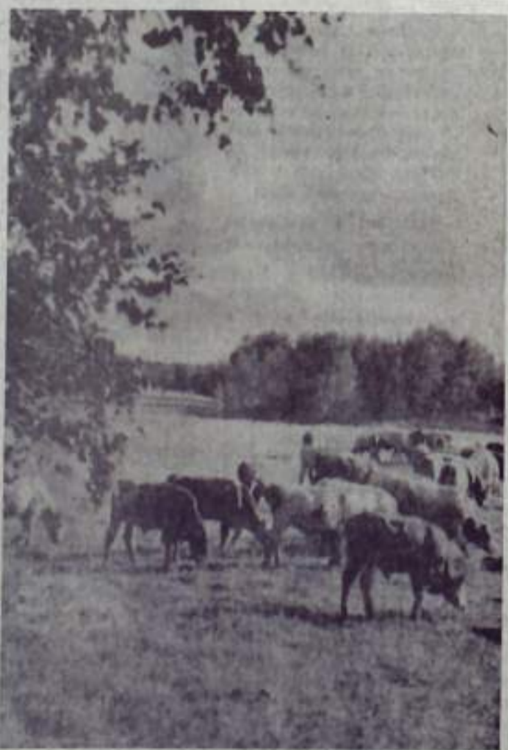
144 овцы пасбище.