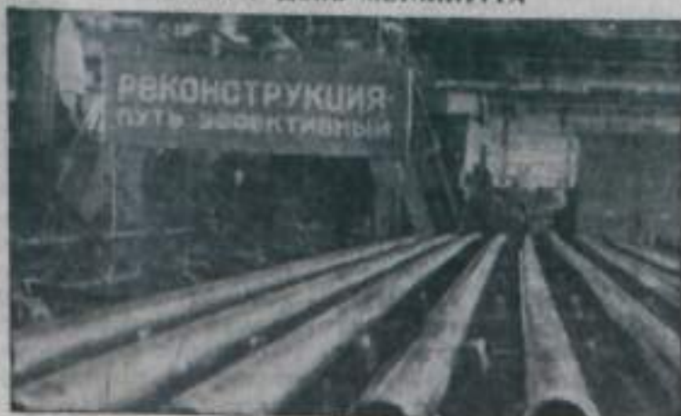
РЕКОНСТРУКЦИЯ ПУТЬ ИЛЬИЧА

Свердловская область. Коллектив Каменск-Уральского металлургического завода на прежних производственных участках организовал выпуск новой продукции, трубы для бурения разведочных нефтяных и газовых скважин на глубину 7—15 тысяч метров. Их изготавливают из легкого прочного сплава. За счет реконструкции производства металлургия Каменск-Уральского сэкономила народному хозяйству свыше 5 миллионов рублей.