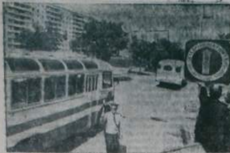
Оренбург. Днем и ночью горю стоят на страже точного соблюдения законов дороги инспекторы дорожно-патрульной службы ГАИ. Благодаря их активной работе в городе и области за последние годы значительно снижено количество дорожно-транспортных происшествий.

Нынешняя служба госавтоинспекции — это отряд высококвалифицированных специалистов, оснащенных современными техническими средствами. Многие аварийные ситуации предупреждены с помощью вертолета ГАИ. На предприятиях и в организациях действует общественные посты по наблюдению за безопасностью дорожного движения. Госавтоинспекторы поддерживают тесный контакт с водителями предприятий, распространяют полезный опыт. Оренбургская ГАИ награждена серебряной и бронзовой медалями ВДНХ СССР.