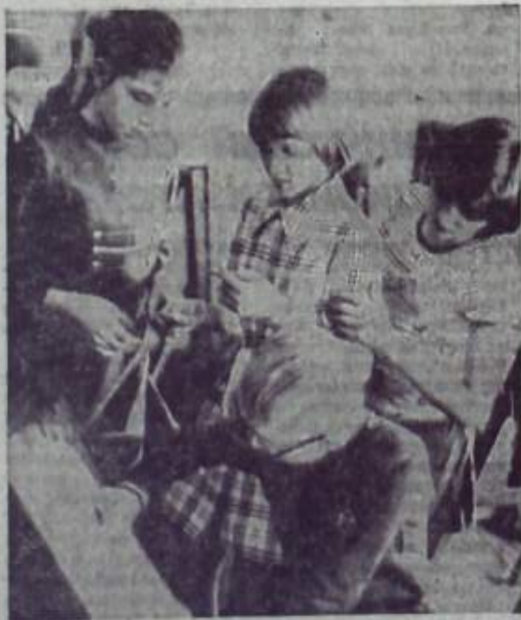
Заботой о детях, об их творческом становлении призваны будни педагогического коллектива Кумертауской детской художественной школы. Здесь находят свое призвание десятки девочек и мальчишек.