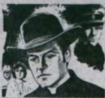
ИСКУШЕНИЕ ЧУЖИХ ГРЕХОВ

О событиях, происшедших в маленьком курортном городке на границе Испании и Франции осенью 1938 года, вы узнаете из фильма «Бархатный сезон».