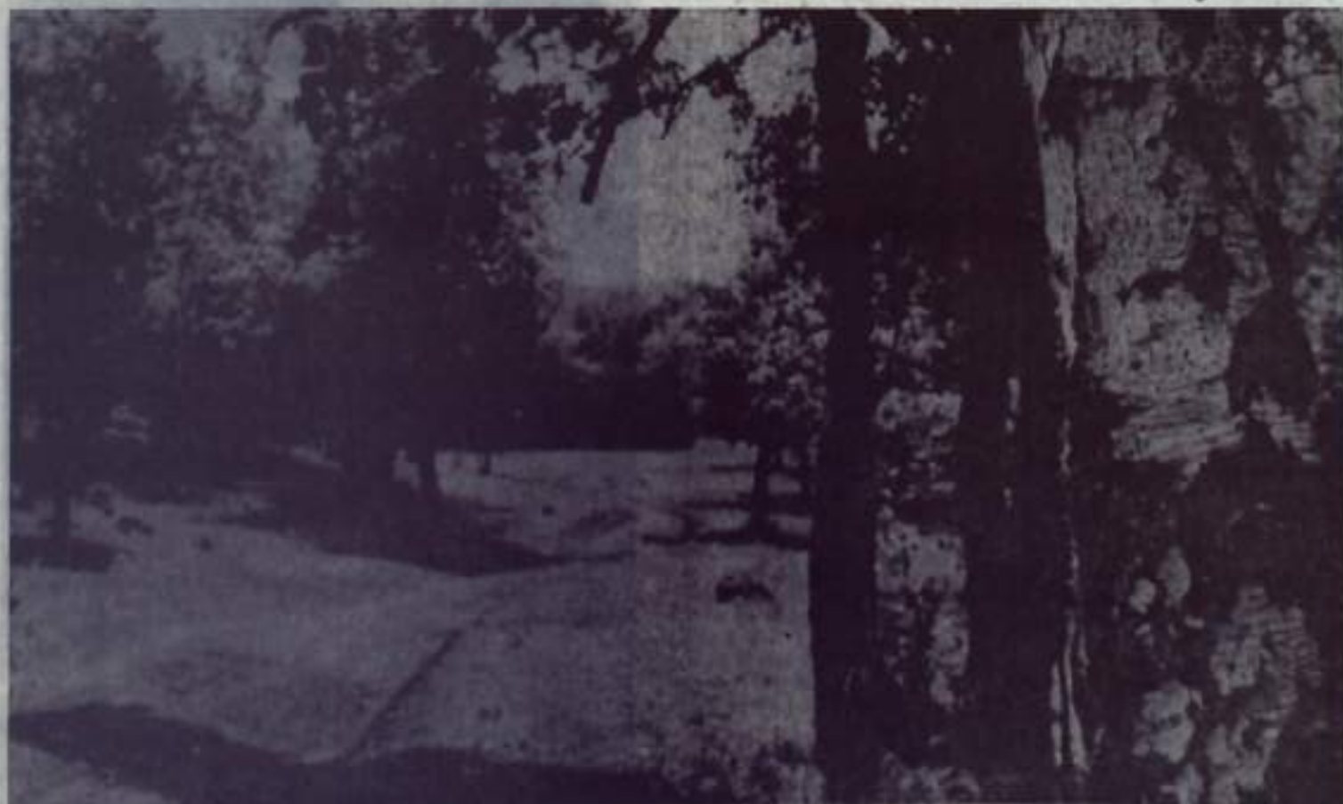
ИЮНЬ. В ОКРЕСТНОСТЯХ КУМЕРТАУ.