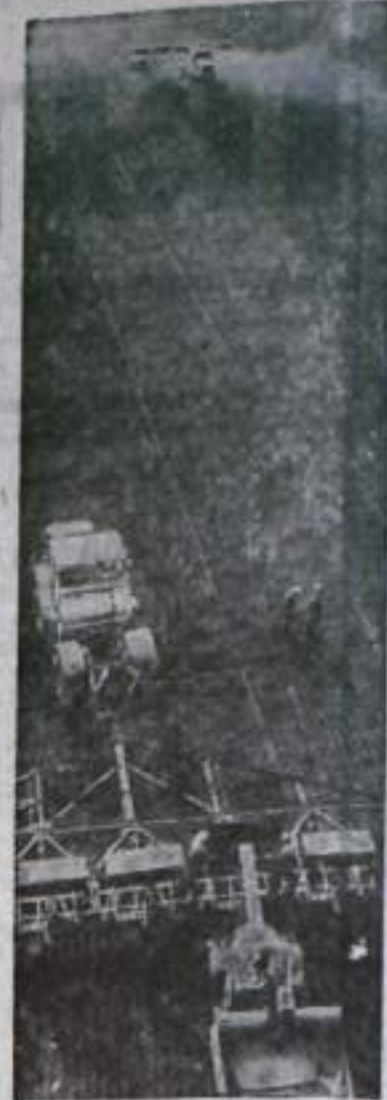
В Северном Казахстане развернулись полевые работы. Механизаторы прилагают все усилия и тому, чтобы провести сев зерновых в лучшие агротехнические сроки.

Первыми в Северо-Казахстанской области приступили к севу колхозы Бишкульского района — инициаторы республиканского соревнования за досрочное выполнение пятилетки. В нынешнем году бишкульцы взяли обязательство собрать по 20 центнеров зерновых с гектара.