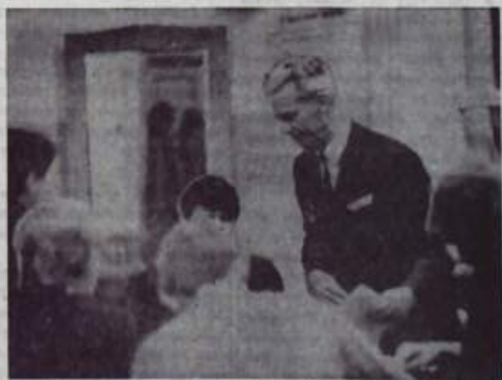
Режиссер Н. И. ПАВЛОВ.

Кинотеатр «ГОРНЯК» 1—2 июня — «Мужчины на одно лицо». Сценасы: 1-го — в 12, 14, 18, 20, 22, 24 часа. 2-го — в 14, 16, 18, 20, 22 часа. С 3 июня — «Истоки» (2 серии). Киноклуб «ОГОНЕК» 1—2 июня — «Истоки» (2 серии). Кинотеатр «ЗВЕЗДОЧКА» 1—2 июня — «Самый сильный», «Девчата».