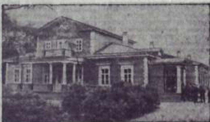
НА СНИМКЕ: Пушкинский музей-заповедник в Болдино (Горьковская область). (Фотохроника ТАСС).