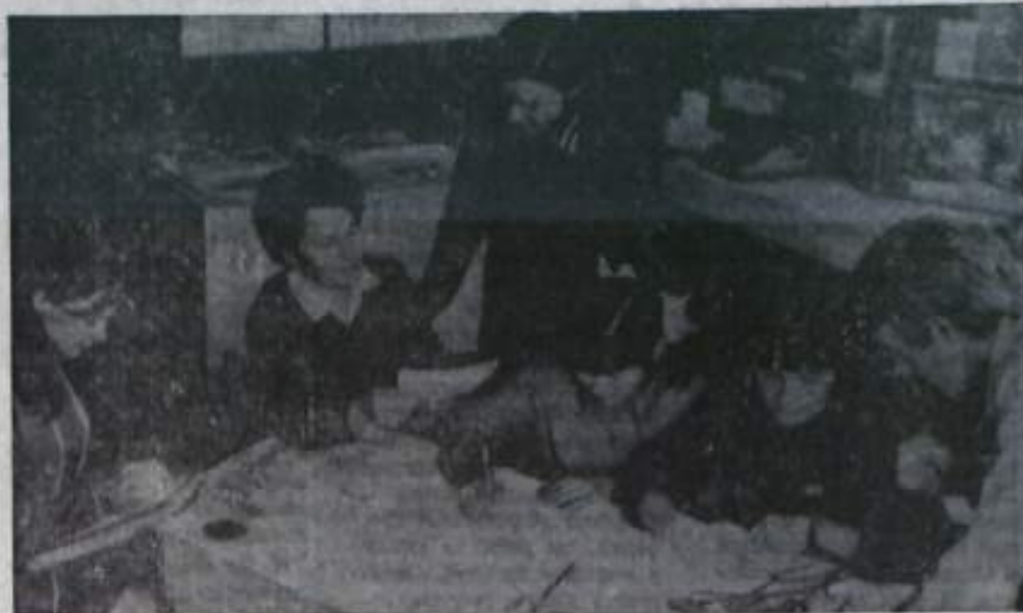
К 50-летию присвоения комсомолу имени В. И. Ленина