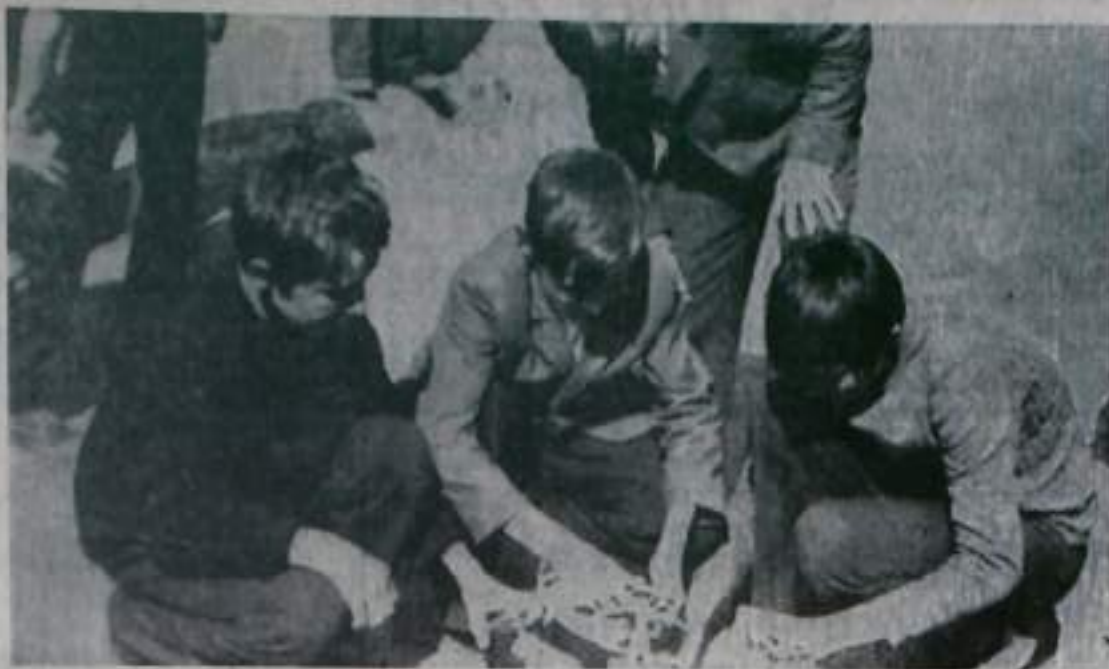
На снимке: один из моментов состязаний юных членов ВДПО.