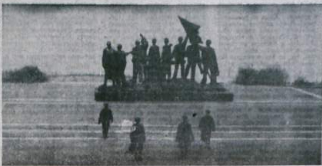
Одиннадцать монументальных фигур на Торжественной площади символизируют непоколебимую веру узников в победу.

Наш корреспондент А. Тодоров рассказывает в своем фоторепортаже о фашистском лагере Бухенвальда.