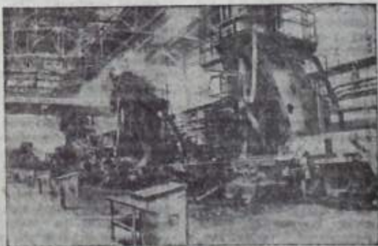
Кемеровская область. На Западно-Сибирском металлургическом заводе ширины 50 летия Октябрь вступил в строй комплекс среднесортного стана «450» мощностью 1.500.000 тонн проката в год. Стан сможет давать около 200 профилей проката. В ходе пуска валочных работ уже получено и отпущено потребителям свыше 30 тысяч тонн проката. На снимке: участок группы чистовых клетей среднесортного стана.