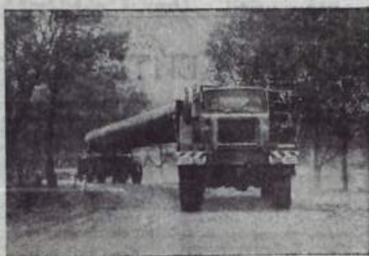
Украинская ССР. Веселыми трудовыми успехами встретили IX съезд Социалистической единой партии Германии строители из ГДР, работающие на 4-м участке газопровода Оренбург—Западная граница СССР. Здесь уже сварено около 50 километров труб при обязательстве 40. Выполнены подготовительные земляные операции на трассе длиной 80 километров. В районе села Глинска (Кировоградская область) разбит передвижной лагерь строителей. Сейчас на газовой магистрали полным ходом идет укладка новых труб.

На снимке: машины доставляют трубы на трассу.