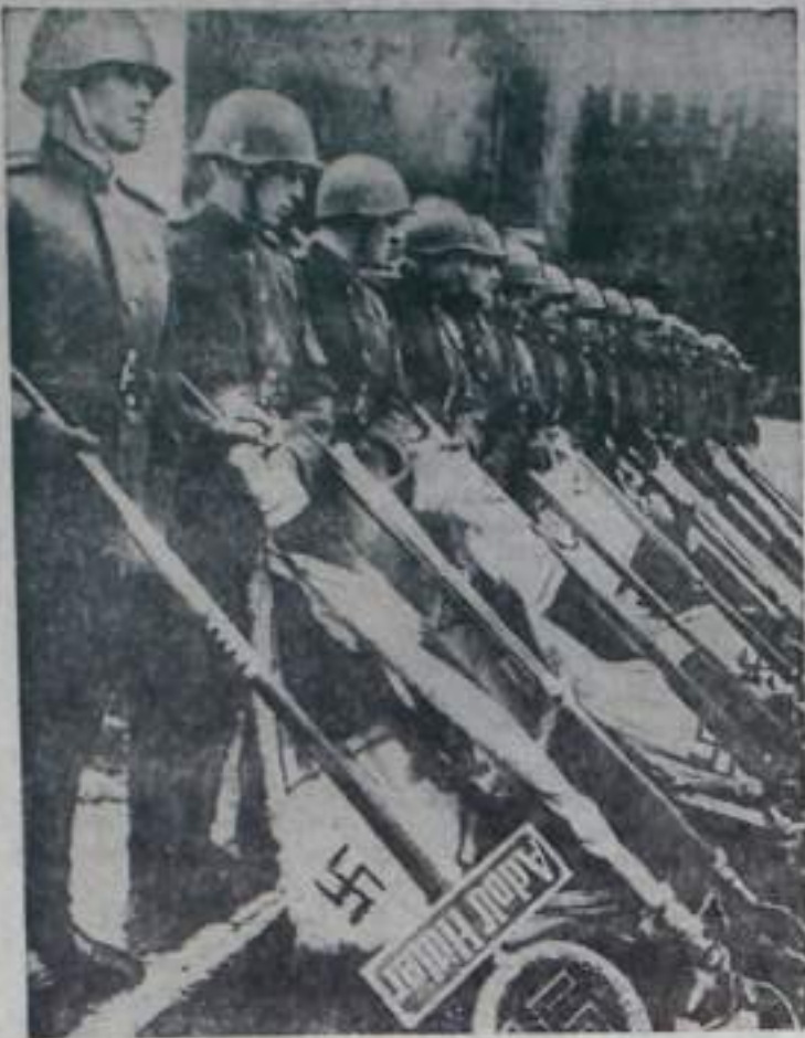
МОСКВА. Парад Победы. Эти гитлеровские знамена будут брошены к подножию Мавзолея.