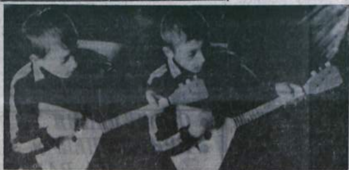
На снимке: на занятии одного из музыкальных кружков городского Дома пионеров.

Рассказывают юные кумертаусцы: чему мы научились в Доме пионеров