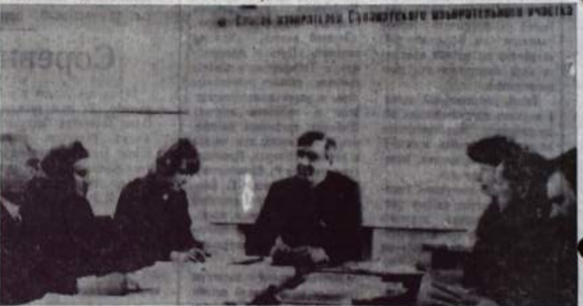
НА СНИМКЕ: семинар агитаторов в ПМК 325.

повышению качества строительно-монтажных работ и улучшению культуры производства, по контролю за улучшением качества, шефства опытных рабочих над молодыми.