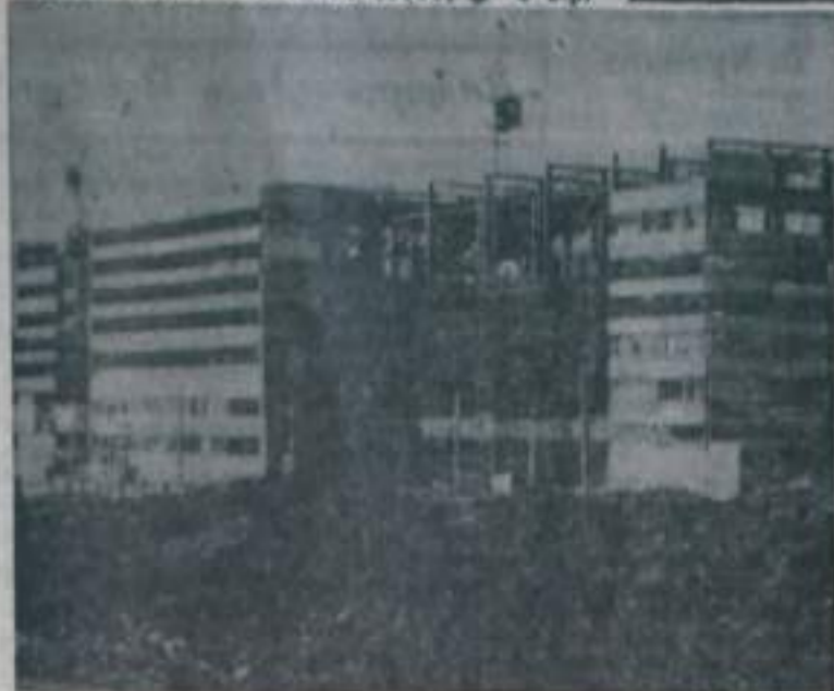
УДАРНАЯ СТРОЙКА ГОРОДА—СУШИЛЬНО-ПРЕССОВЫЙ КОРПУС № 5 БРИКЕТНОЙ ФАБРИКИ.