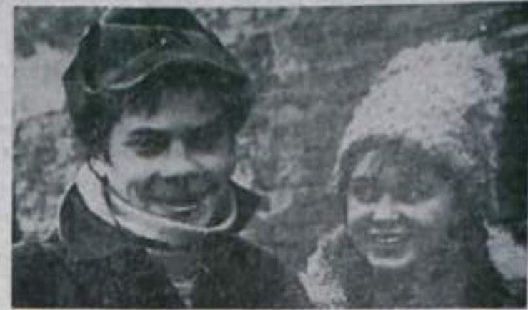
Редактор Н. И. ЛАВРОВ.

Кинотеатр «ГОРНИК» 14—15 мая — «Это сильнее меня». Сеансы: в 12, 14, 18.30, 20.10, 22 часа.