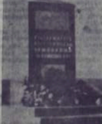
Памятник нашему герою Великой Отечественной войны 3-а Степану Уралову, откритый 3 мая 1975 г.

3. Дипломатия: Гринберг Л. А. Советская власть — власть трудящихся, М., «Взгляд», 1972.