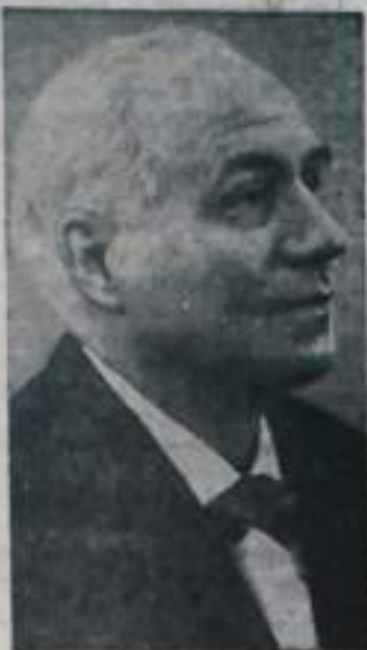
Среди близких и дорогих артистов, искусство которых давало радость не одному поколению советских людей,—

(24 марта исполнилось 75 лет со дня рождения)