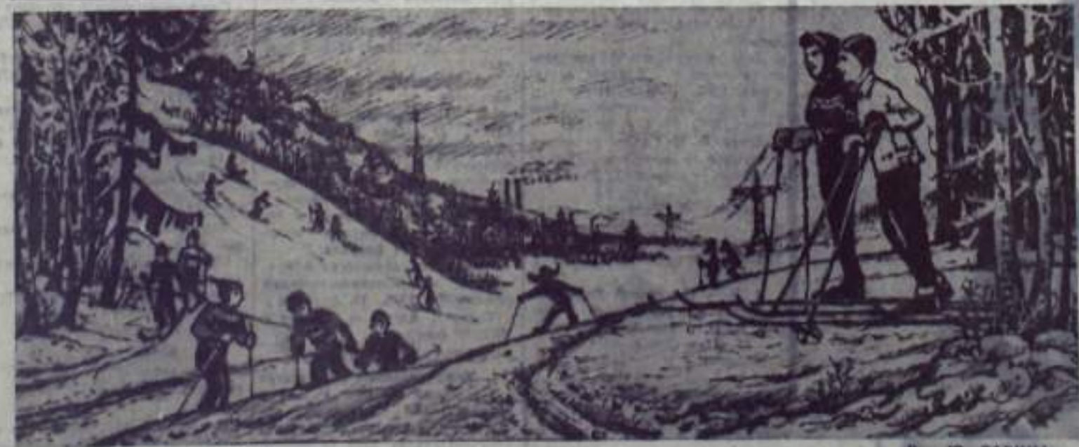
НА ЛЫЖНОЙ ПРОГУЛКЕ

На солнечных глинистых склонах и по откосам железнодорожных насыпей вы можете набрать будет первых весенних цветов. Здесь зацветут цветы мать-и-мачехи. Ее желтые цветы похожи на корзинки одуванчика, но их меньше. Летом у нее остаются только листья, большие (10—15 сантиметров), почти круглые, с зубчатыми краями, сверху гладкие, голые и зеленые, а снизу белые и пушистые. Кипяченый настой мать-и-мачехи применяют от