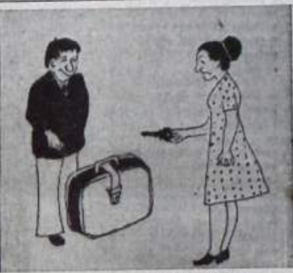
Рис. Р. ХАСАНОВА.