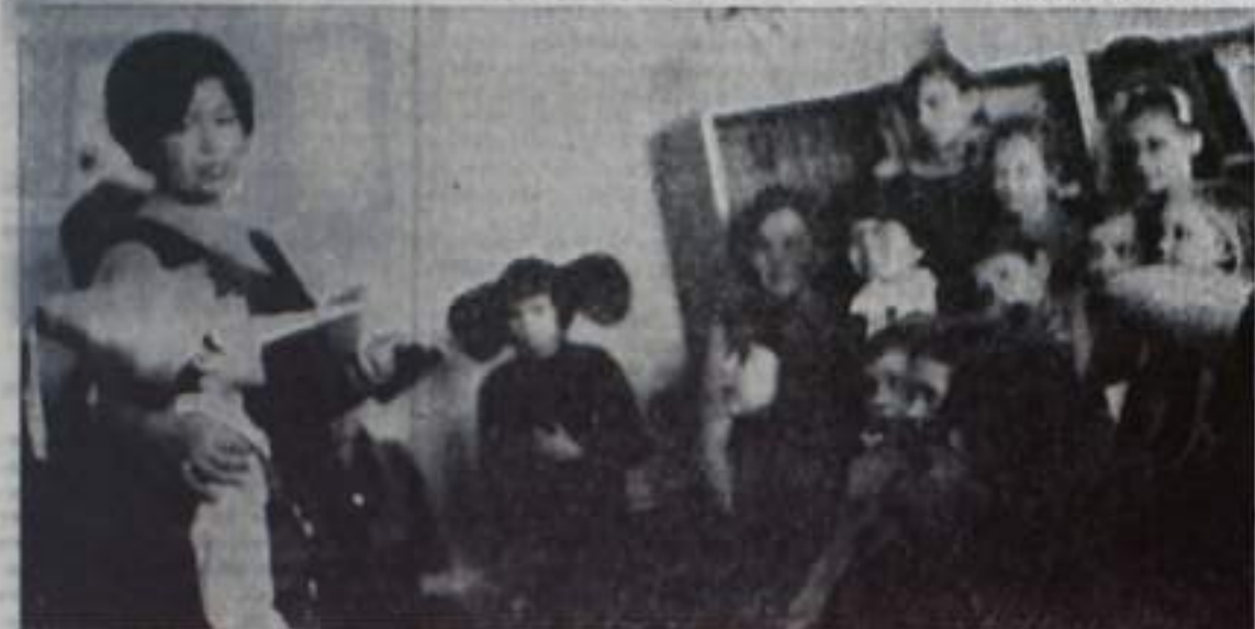
КАК ВАС ОБСЛУЖИВАЮТ