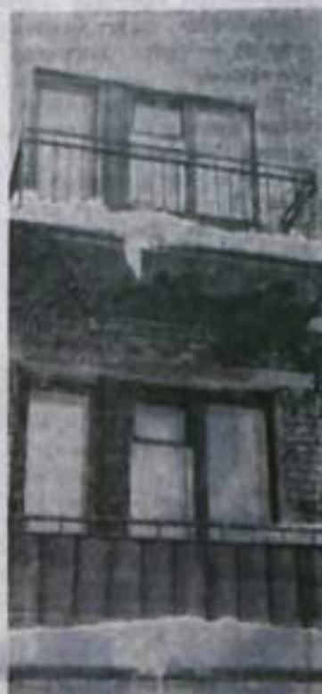
На дворе — весна. Капель течет с крыши, а кое-где и... с балконов. Да, у нерадивых квартиростроителей до сих пор лежит снег на балконах. И нет до него дела техникам-смотрителям домууправлений, проходят мимо таких фактов и народные контролеры.

Все эти вопросы подготовки к торговле обслуживанию населения в весенне-летний период