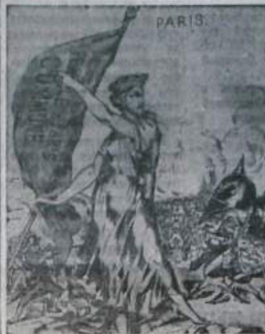
18 марта 1871 года парижские рабочие стали атаманским классом, по образному выражению К. Маркса, поднялись «штурмовать небо». Парижская Коммуна — это первое в истории