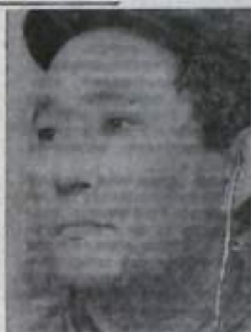
неоднократно выглазил он победителем в социалистическом соревновании.