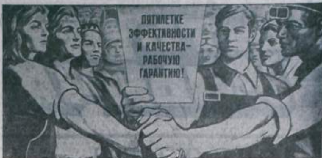
Плакат художников И. ТОИДЗЕ и А. ТОИДЗЕ. Издательство «Плакат».

В ЯНВАРЕ—ФЕВРАЛЕ ПРОМЫШЛЕННОСТЬЮ ГОРОДА ПРОИЗВЕДЕНО ПРОДУКЦИИ СВЕРХ ПЛАНА НА 1043 ТЫС. РУБЛЕЙ, ПЕРЕВЫПОЛНЕНО ЗАДАНИЕ ПО РЕАЛИЗАЦИИ ПРОДУКЦИИ, ПРОИЗВОДИТЕЛЬНОСТЬ ТРУДА ПРОТИВ ДВУХ МЕСЯЦЕВ 1976 г. ВОЗРОСЛА НА 8,7 ПРОЦЕНТА.