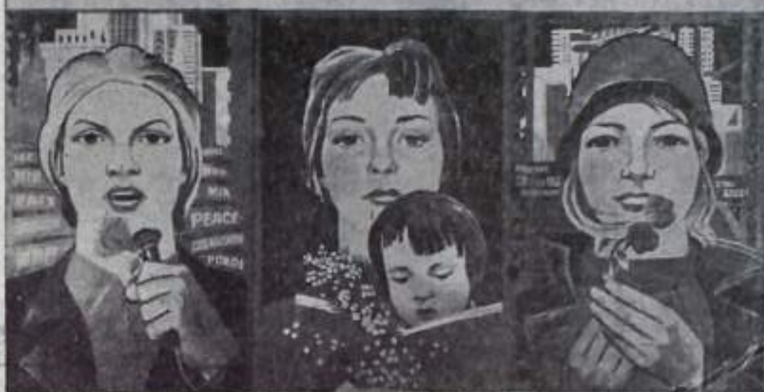
Плакат художника Э. АРЦРУНЯНА.