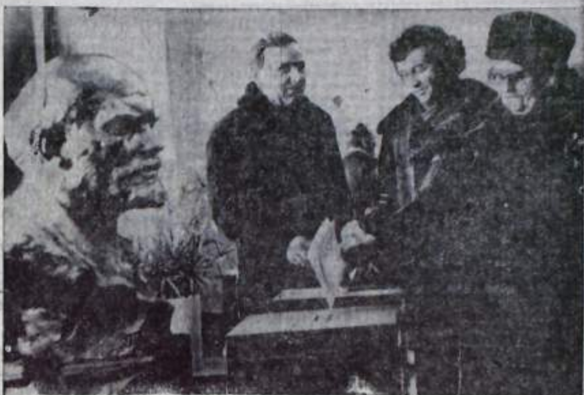
Идет голосование на Ленинском избирательном участке.

— Горжусь нашим городом, — подчеркивает он, — горячо поддерживают и единодушно одобряют внутреннюю и внешнюю политику Коммунистической партии, благодая успешному осуществлению этой порой неуживчиво лозунгов благополучия советских лю-