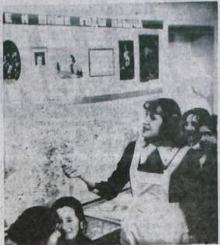
мажорной из детских сидов.