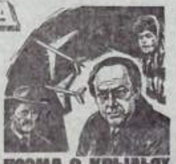
ПОЭМА О КРЫЛЯХ

кка, конечно же, слезам не верит. Это совсем не шутка, не веселая дань поголовья, а грустная истина. Сколько ни плачь, а восемь миллионов не будут рыдать вместе с тобой.