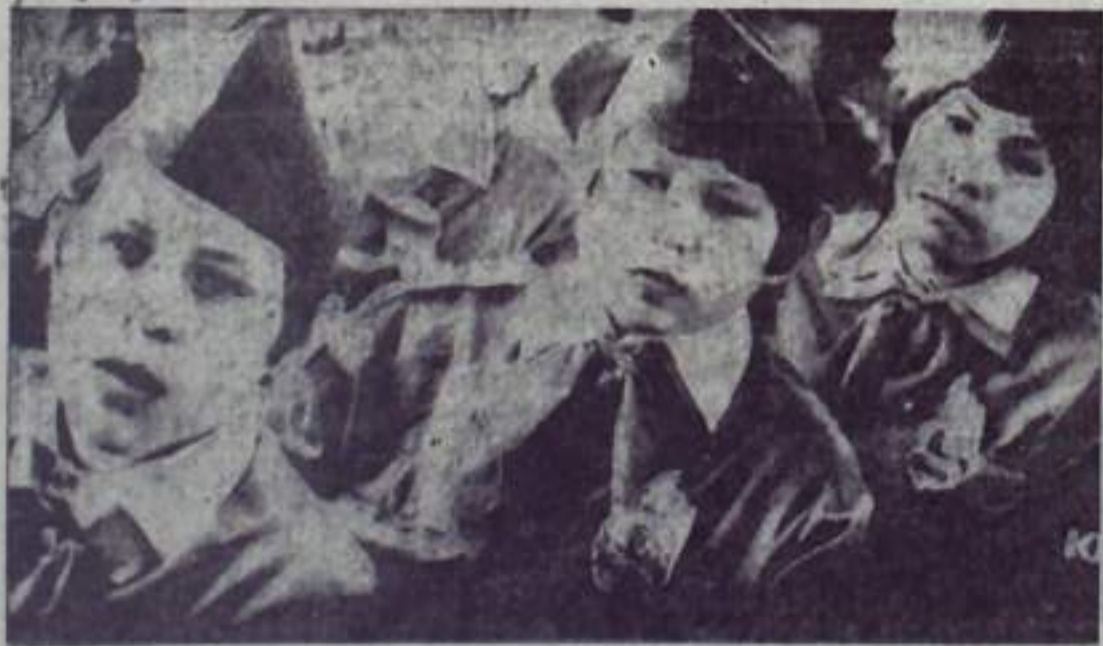
На слете юных пожарных были подведены итоги работы дружин школ города и района за этот учебный год.

Создать новые спортивные базы и сооружения необходимо. Но нужно разумно и полностью использовать то, что у нас есть, добиваться, чтобы всегда оживленными были спортивные залы, площадки и клубы, стадион и лыжная трасса. Необходимо обеспечить широкое внедрение физической культуры и спорта на каждом предприятии, поднять спортивную работу на высокий уровень.