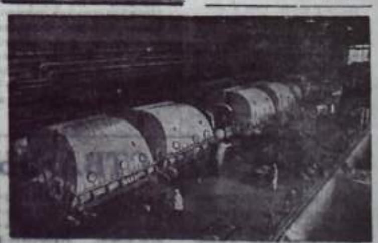
Ленинградская атомная электростанция имени В. И. Ленина, построенная с уран-графитовыми реакторами, охлаждаемыми кипящей водой.—крупнейшая в Советском Союзе. Ее главный корпус состоит из двух энергетических блоков с общим машинным залом в раздельных помещениях для реакторов.

Пуск ЛАЭС—большое событие в мире использования энергии атомного ядра. За короткий период эксплуатации электрическая мощность первого блока станции достигла до одного миллиона киловатт.