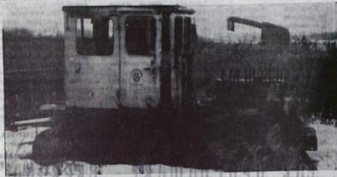
В ГОРОДСКОМ КОМИТЕТЕ НАРОДНОГО КОНТРОЛЯ