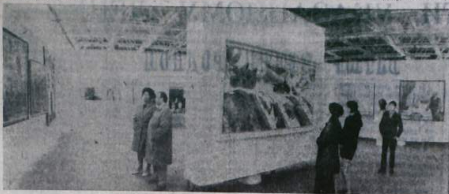
УФА. Выставка «Урал социалистический». В одном из залов павильона «Живопись».