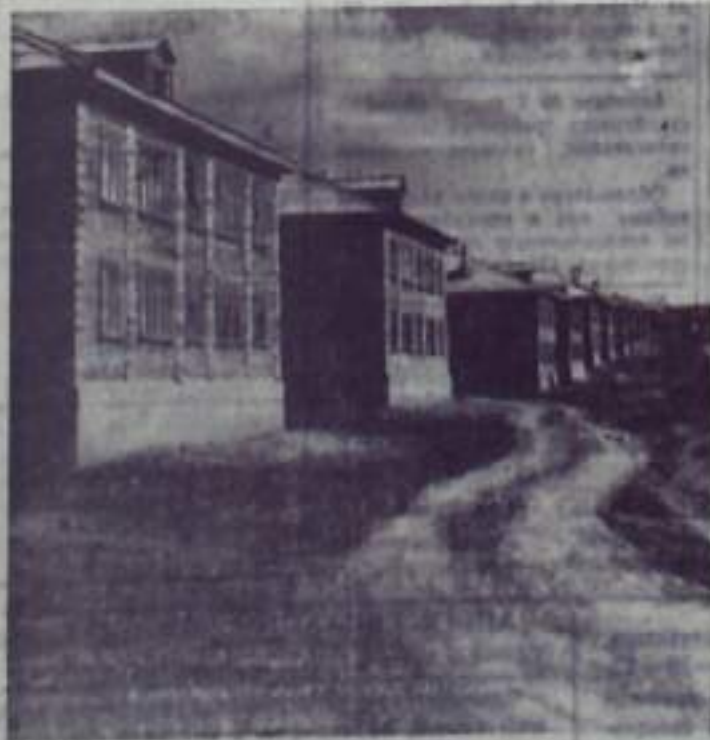
ТАКОЙ БЫЛА УЛИЦА СОВЕТСКАЯ В 30-х ГОДАХ (СЛЕВА).