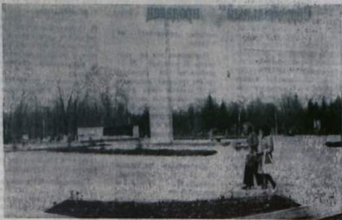
УФА. МОНУМЕНТ ПАВШИМ РЕВОЛЮЦИОНЕРАМ, УСТАНОВЛЕННЫЙ В ПАРКЕ ИМ. ЯКУТОВА.