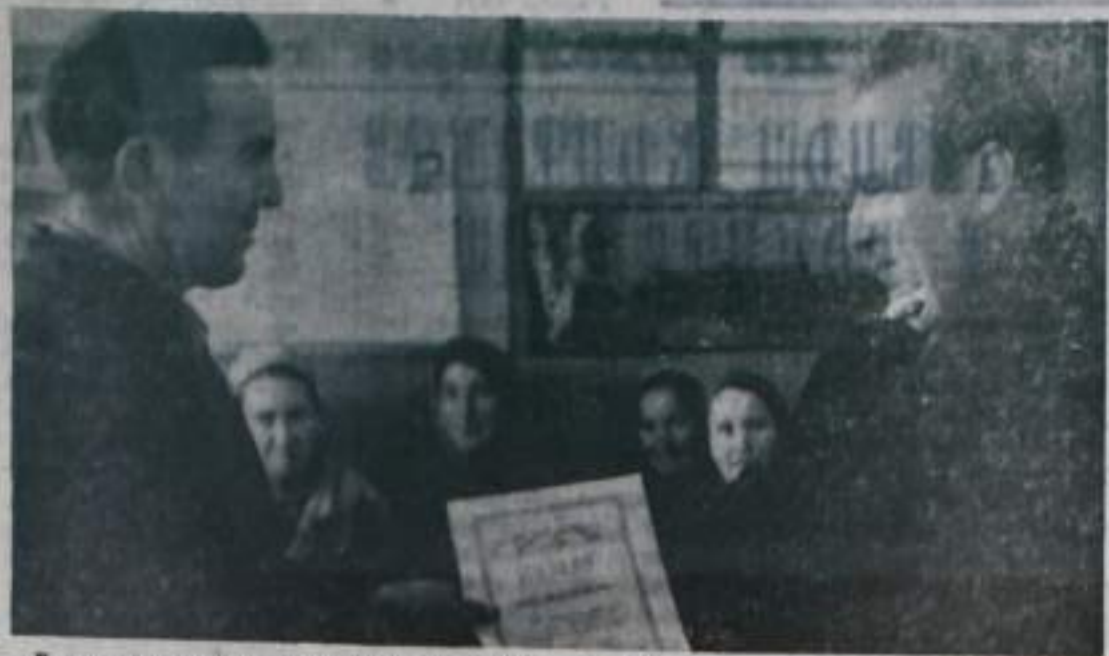
Хорошо подготовили животноводческие фермы - животные скота труженики колхоза имени Кирова.

По решению специальной комиссии исполкома райсовета Ново-Муралатовской и Старо-Муралатовской ферм вручены паспорта готовности