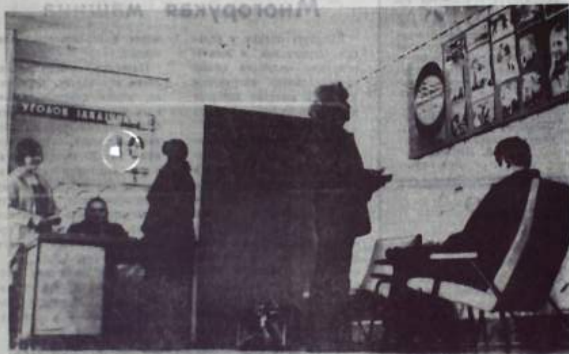
Как уже сообщалось, по ул. Пушкина открыт фотозалон. Он оснащен необходимыми техничес-