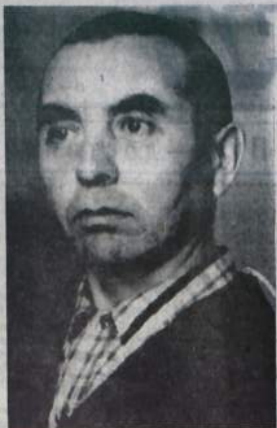
Фото и текст В. НЕЛЮБИНА.