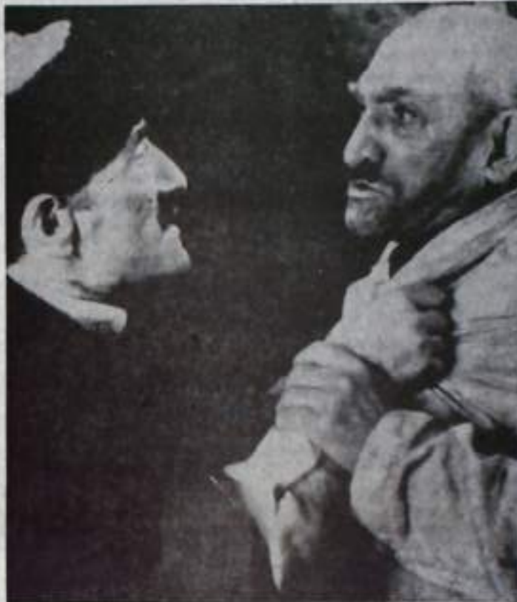
На снимке: кадр из фильма «В Баку дуют ветры».