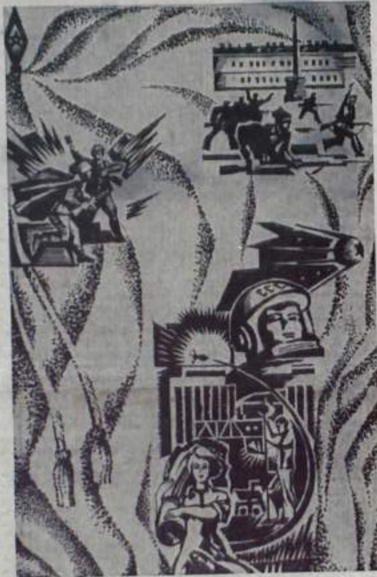
Рис. художника Р. КАРИМБАЕВА.