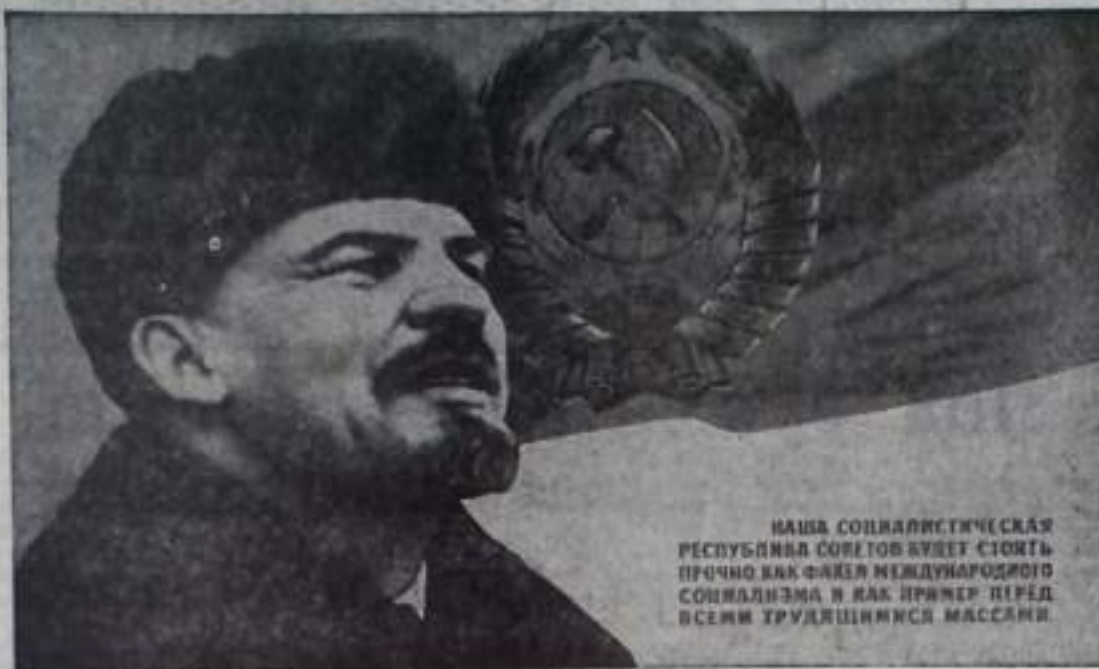
НАША СОЦИАЛИСТИЧЕСКАЯ РЕСПУБЛИКА СОВЕТОВ ВУДЕТ СТОИТЬ ПРочно как ФАКЕЛ МЕЖДУНАРОДНОГО СОЦИАЛИЗМА И КАК ПРИМЕР ПЕРЕД ВСЕМИ ТРУДЯЩИМИСЯ МАССАМИ

(На Призывов ЦК КПСС к 59-й годовщине Великой Октябрьской социалистической революции).