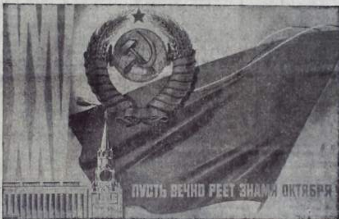
Плакаты художника В. Викторова «Пусть вечно реет знамя Октября» Издательство «Планета».

Высокие технико-экономические показатели достигнуты всеми промышленными предприятиями (кроме завода железобетонных изделий) и в октябре. Потребит-