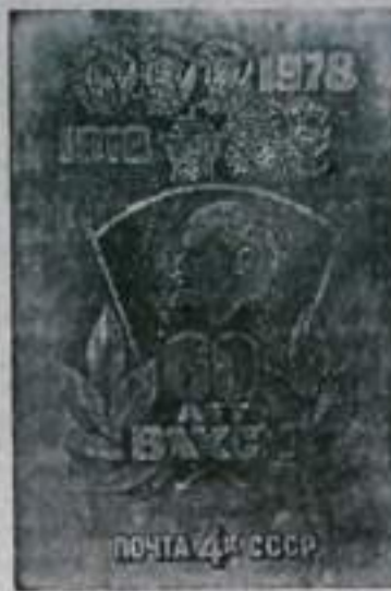
Москва. Министерство связи СССР выпустило почтовую марку, посвященную 60-летию ВЛКСМ (на снимке).