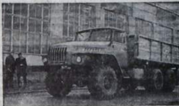
Челябинская область. Осуществление решения июльского (1978 года) Пленума ЦК КПСС, коллектив Уральского автомобильного завода создает для сельского хозяйства новый тягач высокой проходимости с самосвальным кузовом.

Собран первый опытный образец «Урала-5557» (на снимке), который теперь проходит лабораторно-дорожные испытания. Грузоподъемность машины — 7 тонн, а с прицепом — 12,5 тонн. Созданы два варианта бортов: основные — объемом 8,8 кубометра и надставные — объемом 18 кубометров. Все колеса — ведущие, с регулируемым давлением в шинах. Скорость — до 65 километров в час. Кузов машины цельнометаллический, с двусторонней бортовой разгрузкой. Установлен дизельный двигатель «КамАЗ-740» мощностью 210 лошадиных сил.