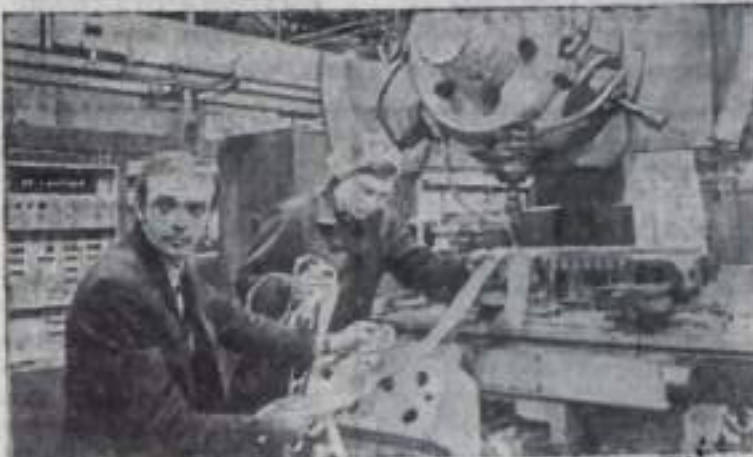
ПО СЛЕДАМ НЕОПУБЛИКОВАННЫХ ПИСЕМ