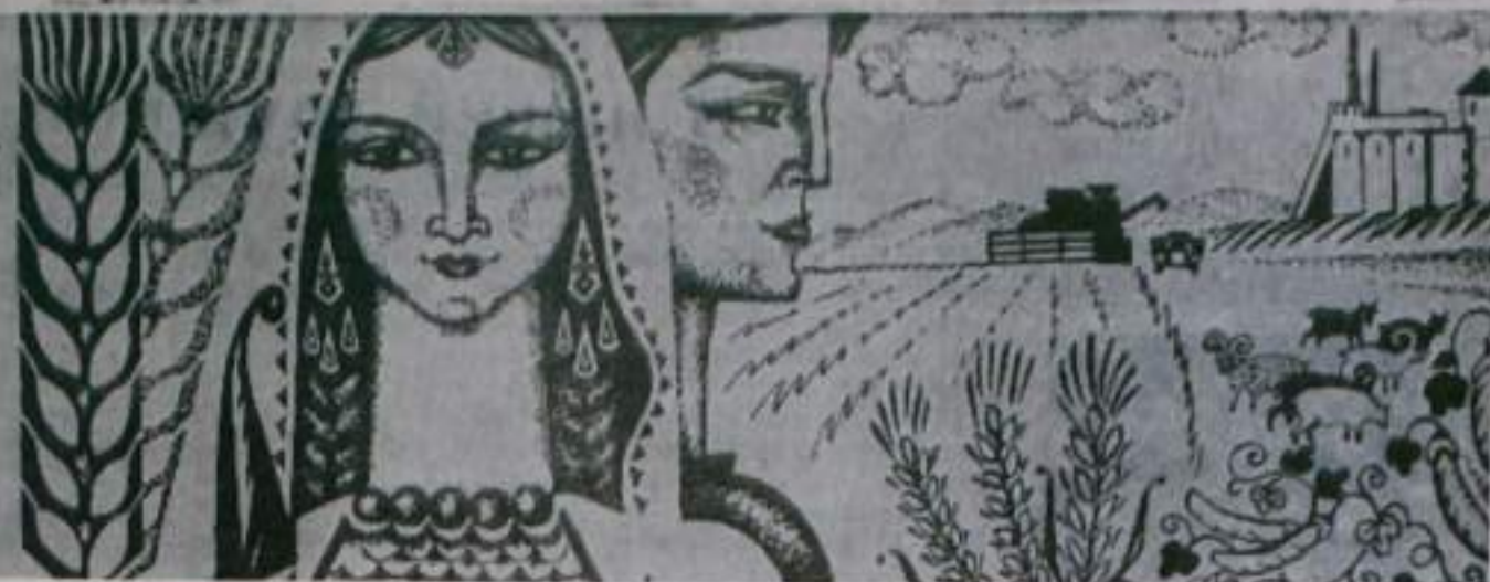
Рис. Р. КАРИМБАЕВА

Завтра — Всесоюзный день работников сельского хозяйства