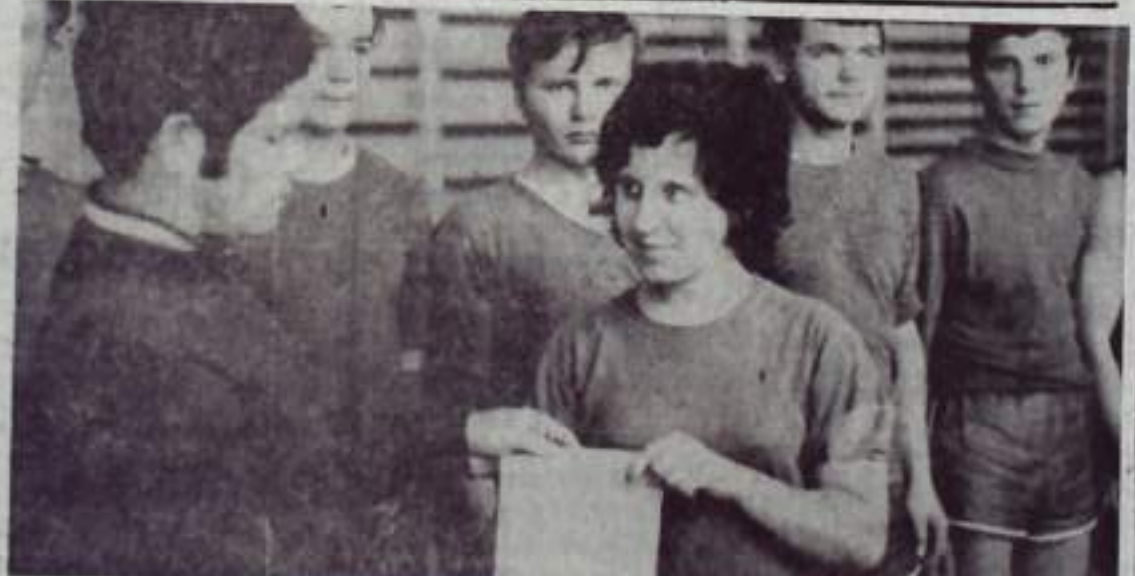
В парнометаллическом техникуме состоялся районный первенства по волейболу.