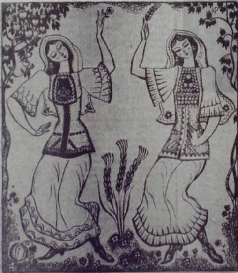
Рис. Р. КАРИМБАЕВА.