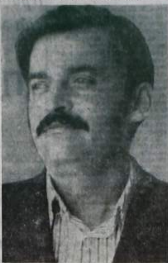
Фото и текст В. НЕЛЮБИНА.