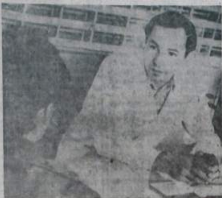
Большую работу по противоалкогольной пропаганде и лечению больных, страдающих тяжелым недугом, ведет наркологи́ческая служба городской поликлиники.