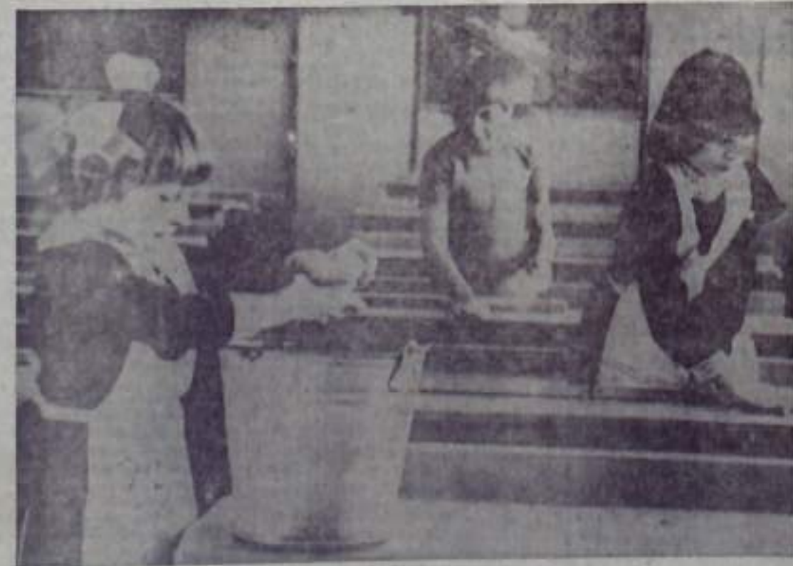
Редактор В. Ю. ТАЙНОВ.

На снимках: подготовка уроков; уборка в классе.