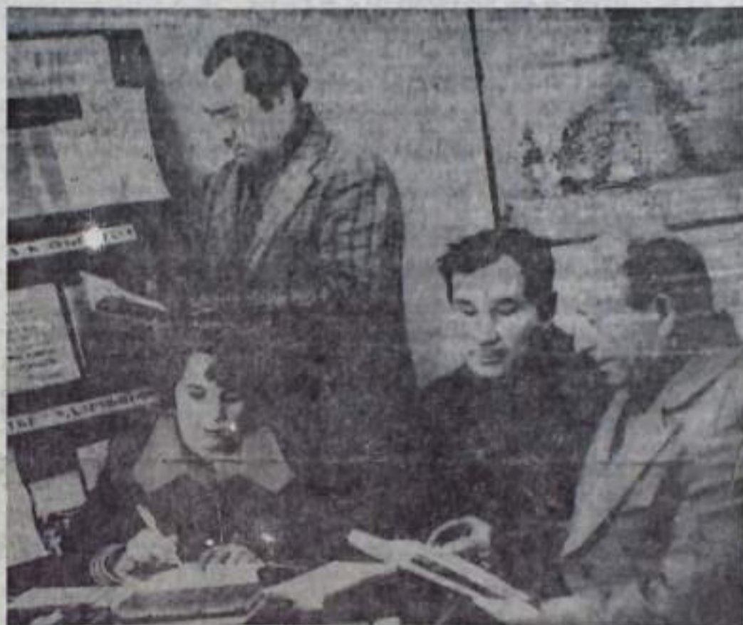
Организовано, на высоком уровне началась политучеба в партийной организации колхоза имени Кирова. НА СНИМКЕ: в партийном кабинете колхоза перед началом занятий.