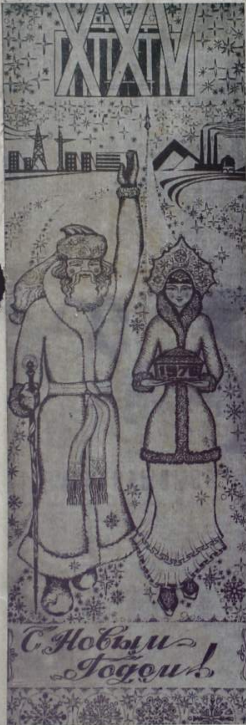
Рис. Р. КАРИМБАЕВА.

О готовности кумертаусцев внести свой вклад в осуществление намеченной партийной программы экономического и культурного развития нашей Родины рассказывается в этом номере.