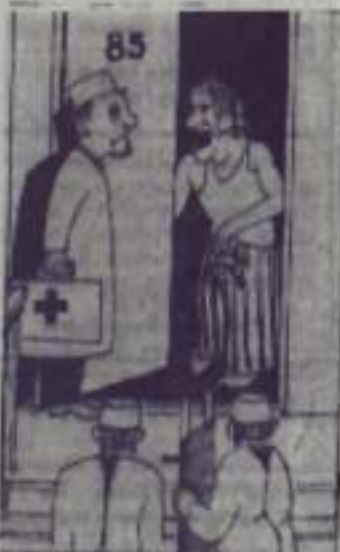
—Смать не дадут— Я уже трот... Рис. Р. ХАСАНОВА.

Перевозка больных с инфекционными заболеваниями должна производиться только транспортом санитарно-эпидемиологической станции. К сожалению, это правило у нас очень часто нарушается. Так, в прошлом году только с напарением врачей транспортом «Скорой» госпитализировано 82 больных с инфекционными заболеваниями из 349 вызванных работников «Скорой помощи». А вот работники СЭС своими прямыми обязанностями—перевозкой инфекционных больных у нас, как правило, не занимаются, ссылаясь на нехватку транспорта. Пора, по примеру других городов, навести в этом деле порядок, тогда заметно возрастет оперативность работы станции «Скорой помощи». Во многом наша оперативность зависит и от самих жителей города.