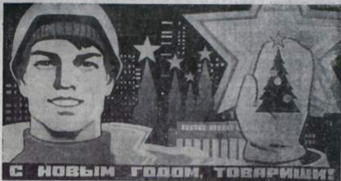
Плакат художника И. Коминарца. Издательство «Плакат».

Особой похвалы заслуживают наши хлеборобы. В 1978 году район с честью выполнил свои высокие социалистические обязательства, и впервые в истории района в закрома Родины засыпано 103 тысячи тонн добротного кумертауского хлеба. Это позволило успешно справиться и с заданием трех лет пятилетки.