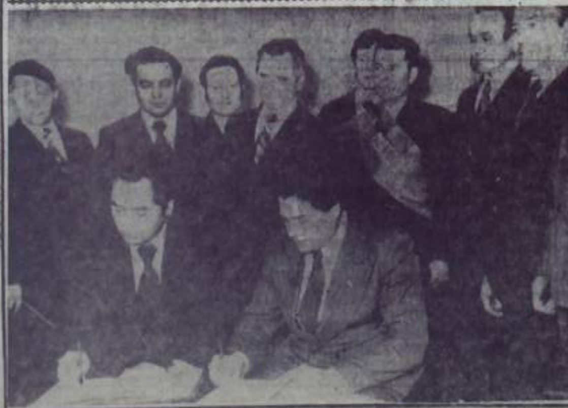
21 января делегация труженников Кумертауского района приняла участие в работе совещания передовиков сельскохозяйственного производства соревнующегося с нами Кугарчинского района, на котором были подведены итоги трудового соперничества земледельцев в 1979 году и заключен договор на социалистическое соревнование районов на завершающий год 10-й пятилетки. НА СНИМКЕ: момент подписания договора.