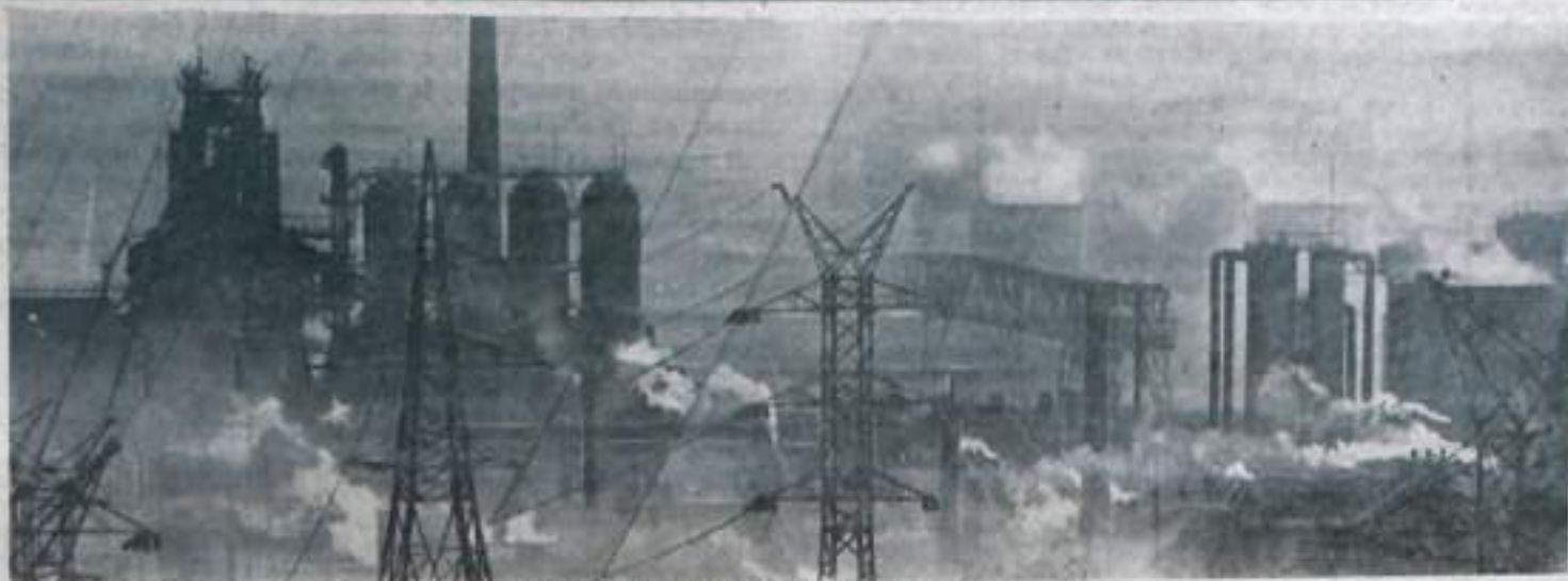
Нузнецкий металлургический комбинат

имели возможности делать ни самолеты, ни автомобили, ни тракторы, ни современные станки. А без всего этого немислим технический прогресс.