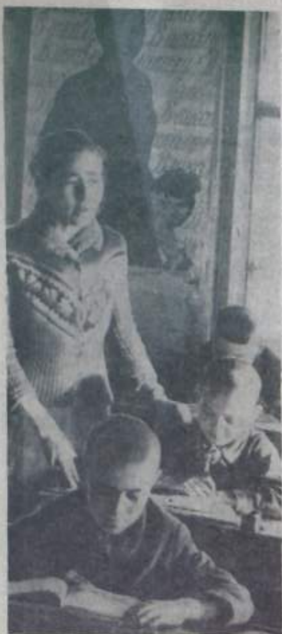
Труд сельского учителя почетен и многогранен. Надо не только учить детей, но и воспитывать их сознательными, трудолюбивыми. С этими большими обязанностями неплохо справляется учительница Илькинеевской начальной