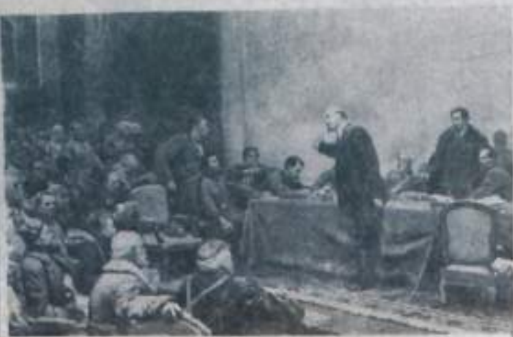
«В. И. Ленин у карты ГОЭЛРО» (VIII Всероссийский съезд Советов). Картина художника Л. А. Шматко.

Но вот наступили мирные дни, и в Москве собрался VIII Всероссийский съезд Советов. Было это в конце декабря 1920 года. Съезд утвердил план ГОЭЛРО —