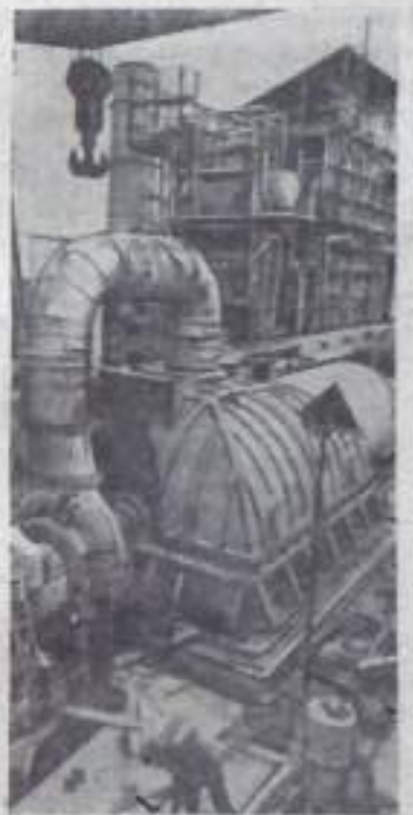
Азербайджанская ССР. Монтаж турбины на Али-Байрамлинской ГРЭС.