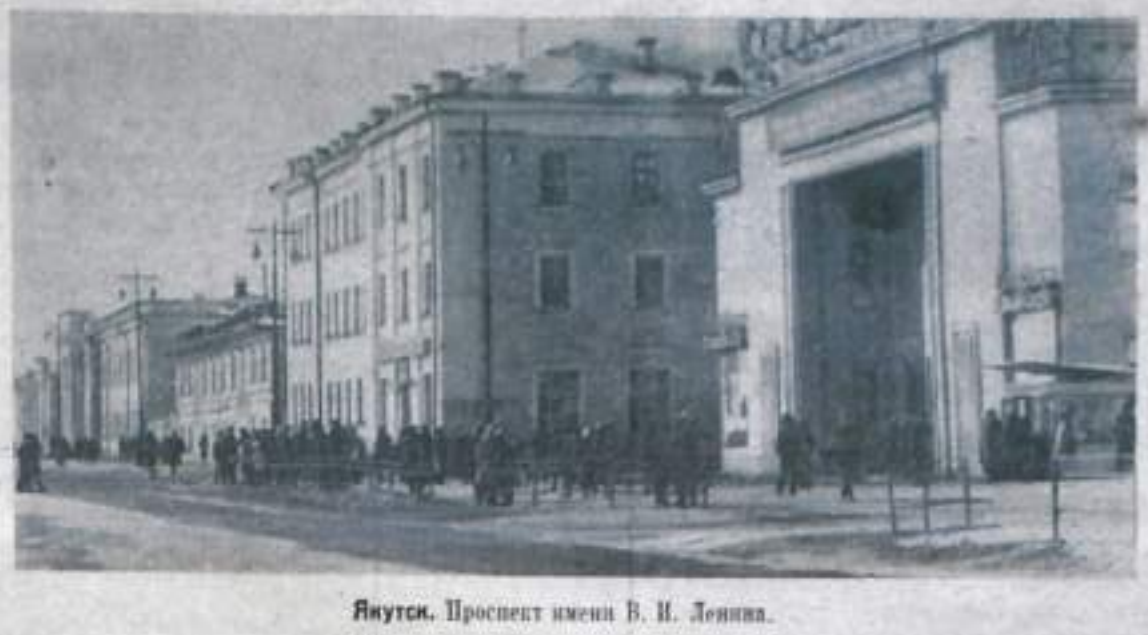
Якутск. Проспект имени В. И. Ленина.