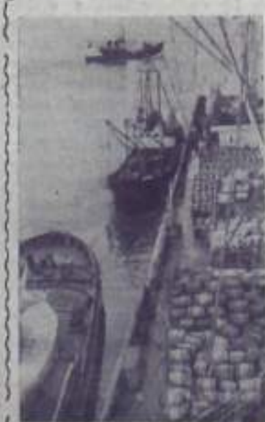
Плавбаза «Полярная звезда» принимает на борт рыбу с судов.