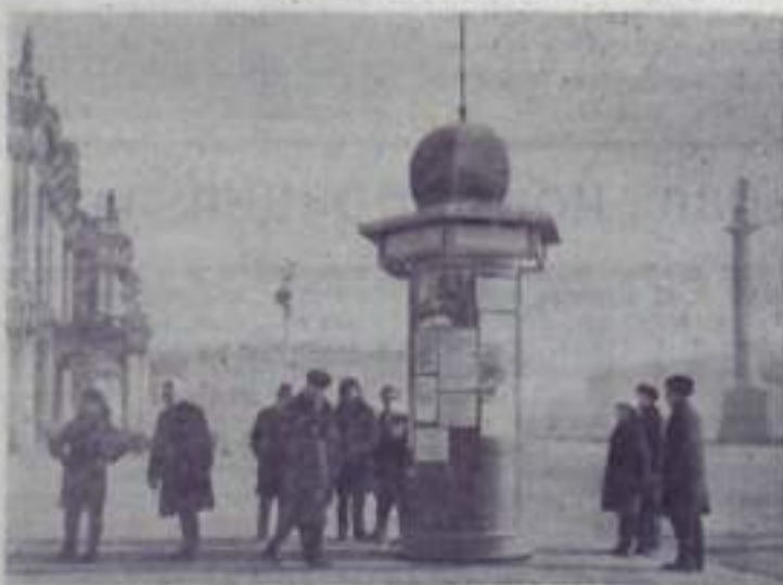
На площадях, проспектах и улицах Ленинграда появились необычные афишные тумбы. На них вывешены фотокопии документов, относящихся к Октябрьским дням 1917 года.

Пройдет немало времени, и материалы, рассказывающие о борьбе за власть Советов, можно будет увидеть на всех главных магистралях Ленин-