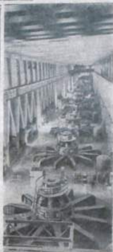
Братская ГЭС. Машинный зал.

В послевоенные годы продолжалось освоение гидроэнергоресурсов. На Волге выросли Горьковская гидроэлектростанция, Волжская ГЭС имени В. И. Ленина и Волжская ГЭС имени XII съезда КПСС, на Иртыше — Усть-Каменогорская и Бухгарминская, на Оби — Новосибирская, на Ангаре — Иркутская и Братская гидроэлектростанции. Целый каскад ГЭС появился на Днепре. 24 новых ГЭС дали ток в Закавказье, 41 — в Средней Азии. С 1958 года, после того, как на полную мощность была введена Волжская ГЭС имени В. И. Ленина, Советский Союз является обладателем крупнейшей электростанции мира. Сейчас это первенство удерживает Братская ГЭС, а через несколько лет оно перейдет к Красноярской ГЭС на Енисее, первые агрегаты которой начнут вырабатывать электроэнергию к 50-летию Советской власти. Сейчас сооружается много новых ГЭС.