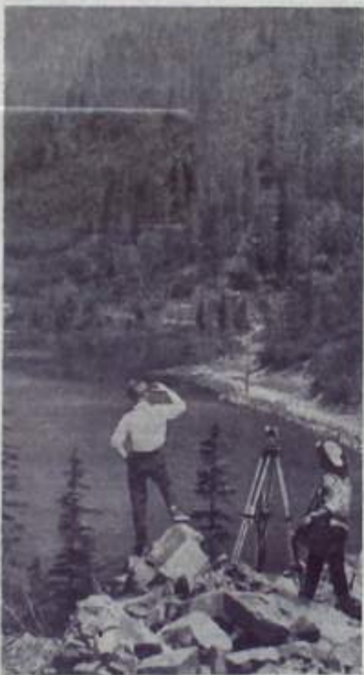
На снимке: дальневосточные разведчики недр на таинном озере Амур.

«ПУТЬ ИЛЬИЧА» 2 стр. 2 апреля 1967 года.