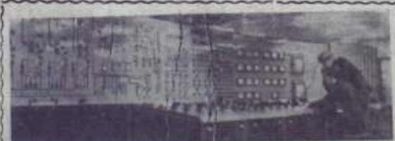
Новейший металлургический завод. С этого пульта, оборудованного новейшими приборами, управляется работа мощной доменной печи.

И, наконец, о машиностроении — сердце тяжелой индустрии. Оно по сравнению с 1913 годом увеличилось в 534 раза. При этом произошли огромные качественные сдвиги. Ракетные установки, посылающие многочисленные космические станции в звездную высь, и исполинские турбоагрегаты мощностью в 800 тысяч киловатт, электронные вычислительные машины и точнейшие станки с программным управлением, самые большие в мире