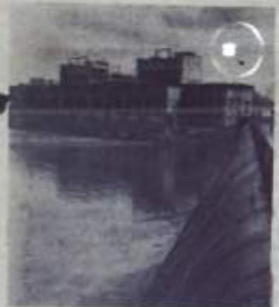
Волховская ГЭС — первенец советского гидроэнергетического строительства.

«ПУТЬ ИЛЬИЧА» 3 стр. 2 апреля 1967 года.