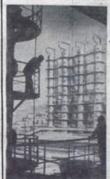
ЕРЕВАН. Отделение рафинирования завода «Поливинилцеллюлоза».

Третью пятилетку прервала война. Она особенно ясно показала всю мудрость Ленина и правильность политики партии, не жалевшей сил для создания в кратчайшие сроки переклассной индустрии, без которой мы не смогли бы победить в войне.