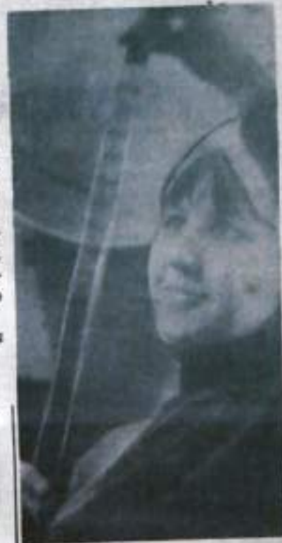
Редактор Н. И. ЛАВРОВ.

Кинотеатр «Горняк» 19 апреля — «Поединок». 19—20 апреля — «Ленин в Октябре». 21—22 апреля — «Прощай».