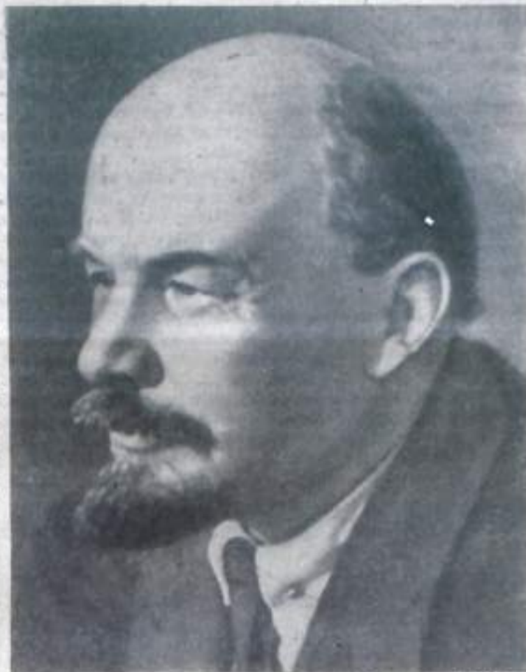
В. И. Ленин. Ноябрь 1921 года.