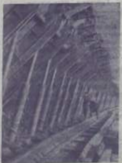
Такая новейшая горная техника применяется теперь в шахтах угольных бассейнов.

Но даже эти цифры не до конца отражали тяжелейшее положение молодой Советской республики. Дело в том, что страна не имела базы квалифицированного машиностроения. Иначе говоря, мы не