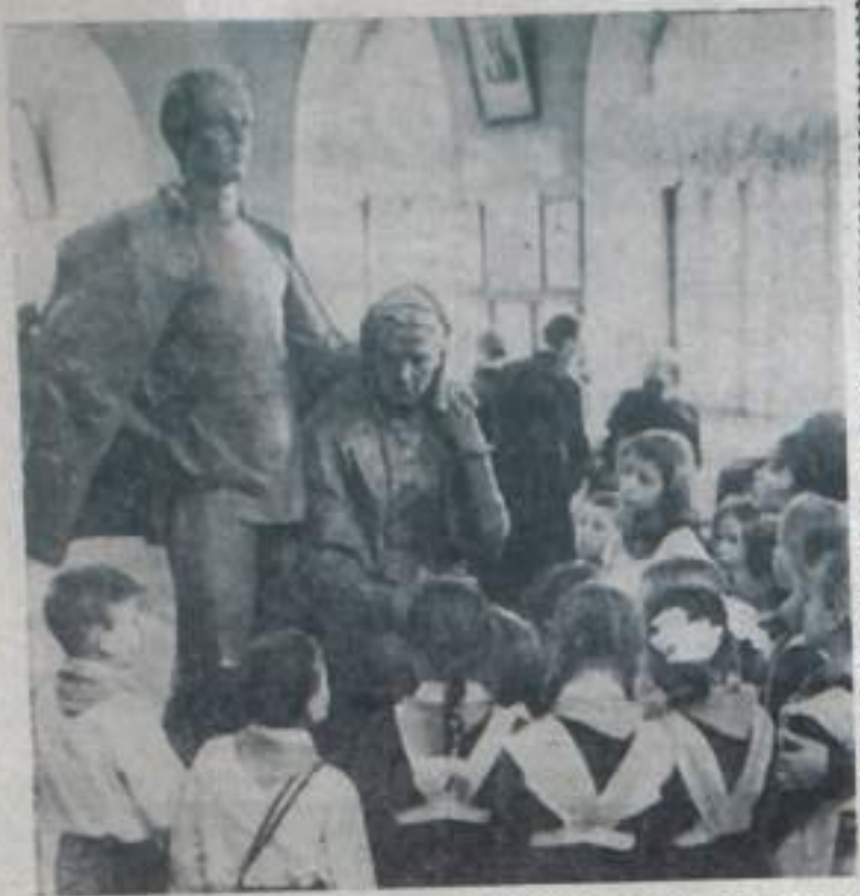
МОСКВА. Накануне 97-й годовщины со дня рождения Владимира Ильича Ленина в Центральном музее В. И. Ленина особенно оживленно.

Здесь, в многочисленных залах собраны исторические документы, личные вещи Владимира Ильича, картины и скульптуры, ярко рассказывающие о жизни и революционном пути великого вождя пролетарской революции В. И. Ленина. Среди посетителей музея всегда можно увидеть школьников и людей старшего поколения, приехавших на экскурсию в столицу из многих областей и республик нашей Родины. Частыми посетителями музея являются иностранные туристы и делегации из разных стран мира.