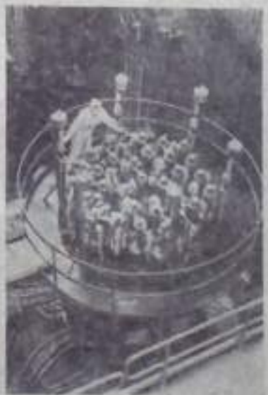
Реактор Нововоронежской атомной электростанции.

«ПУТЬ ИЛЬИЧА» 3 стр. 2 апреля 1967 года.