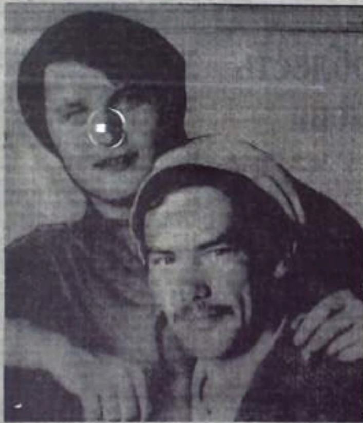
С ЧУВСТВОМ ОТВЕТСТВЕННОСТИ

С высоким подъемом трудится в завершающем году одиннадцатой пятилетки коллектив ремонтно-механического завода производственного объединения «Башкирмаш». Здесь производится капитальный ремонт торного оборудования, изготавливаются и чинят запасные части. Заводчане торопятся выполнить, как много зависит от них, чтобы имеющиеся на службе у горкома оборудования работали надежно и безотказно, и прилагают все усилия и тому, чтобы в честной выполненности поставленные перед ними задачи.