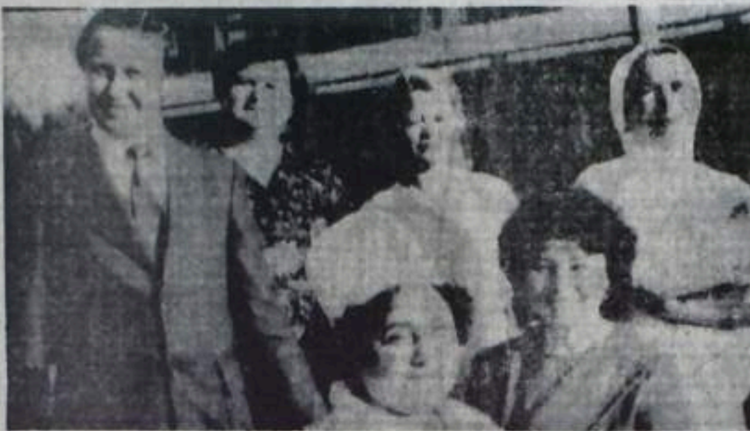
ГОРОДСКАЯ ВЫСТАВКА ЦВЕТОВ