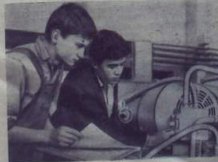
ТУЛЬСКАЯ ОБЛАСТЬ. Узловский машиностроительный завод недаром называют молодежным.