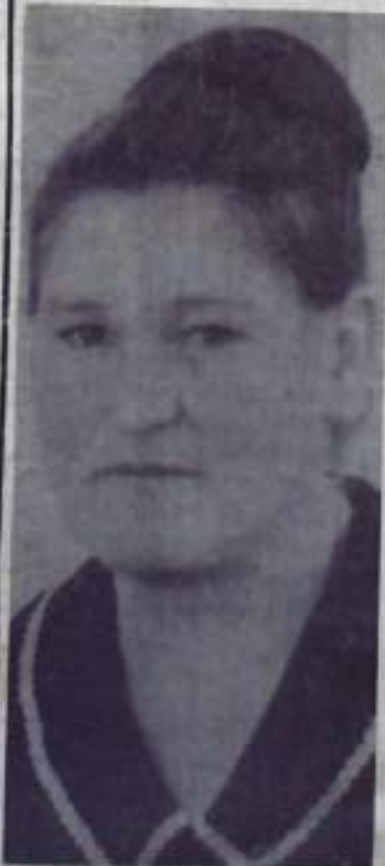
Отличными показателями завершает второй год пятилетки доярка колхоза «Иск-