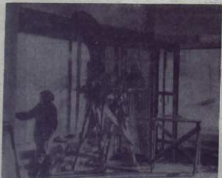
В Ермолаеве, рядом с объединением «Сельхозтехника», полевилось здание, выполненное в современном стиле. На его стеклянных стенах бегают солнечные зайчики. Радостная окраска. «Новинка» — так назовут будущее кафе, и это название как нельзя лучше подойдет к нему. Скоро отделочные работы будут завершены, и светлый зал примет первых посетителей.

«ПУТЬ ИЛЬИЧА» 3 стр. 7 декабря 1967 года.