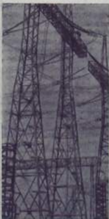
НА СНИМКЕ: на открытой подстанции электропередачи напряжением 750 киловольт.