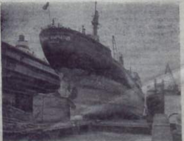
Растет техническое оснащение, строится новые цеха и цеха Ильяшевского судоремонтного завода близ Одессы. Его коллектив решил досрочно выполнить годовой план ремонта судов.

Задачи вперед большие, но коллектив дружный, старательный, и обязательства, несомненно, будут выполнены.