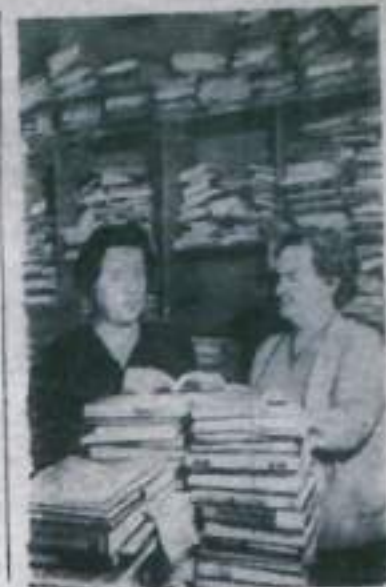
Москва. 35 лет существует центральный коллектор научных библиотек. Его дружный коллектив в тесном контакте с работниками 2000 библиотек, расположенных в городах и научных центрах страны. В юбилейном году работники столичного коллектора проделали особенно большую работу. Они разослали 60 тысяч наименований книг.

Члены парткома подвели итоги социалистического соревнования в совхозе в юбилейном году, а также рассмотрели и одобрили обязательства коллектива совхоза по досрочному выполнению годового плана текущей пятилетки. Партком рекомендовал рассмотренные обязательства для обсуждения и принятия на собраниях рабочих по отделению.