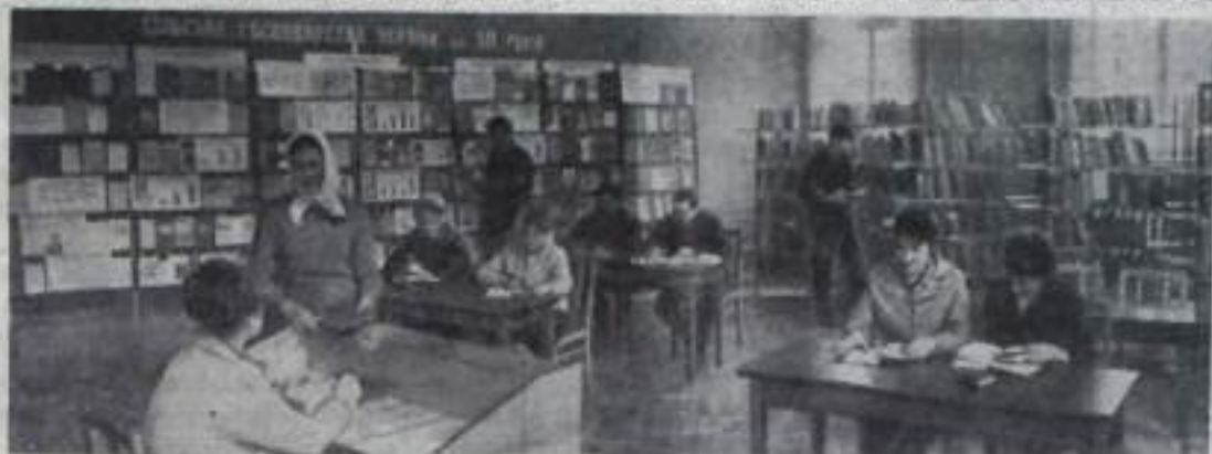
УКРАИНСКАЯ ССР. У читателей и библиотечных работников Хмельницкого большая радость — областная библиотека переселилась в новое здание. К услугам посетителей просторные читальные залы. НА СНИМКЕ: в читальном зале для работников сельского хозяйства.

большими недоделками. Докончим какой урон: депошки они специально покупают. А за бесцельность высылать у нас пока не заведено. Другой раз удивляться приходится: или партийная честь по-разному оценивается? Что ж получается: доконцы терпит моральный ущерб (это в том случае, если у них осталась хоть крупица совести), а строители — материальный. Это разные вещи. Настоящий коммунист должен ценить то и другое и прежде всего должен уметь считать государственную копейку независимо от того, в какой отрасли производства она расходуется. В этом сейчас главное. Ведь мы вступили во второе пятидесятилетие Советской власти.