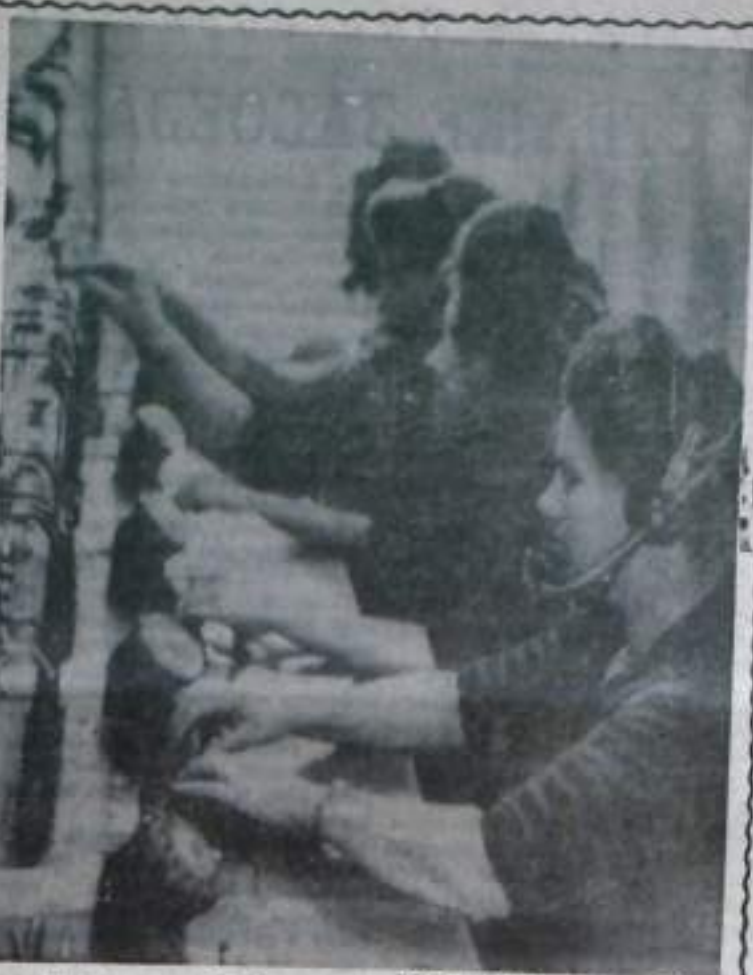
На снимке вы видите телефонисток за работой.