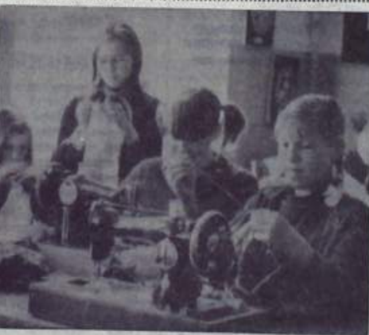
Идет занятие рукодельного кружка.