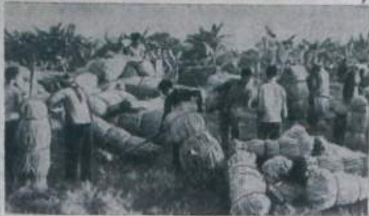
ДЕМОКРАТИЧЕСКАЯ РЕСПУБЛИКА ВЬЕТНАМ. Крестьяне сельскохозяйственного кооператива Тхонг Нхат в пригороде Ханоя собрали по 25 тонн волокон джута с гектара. НА СНИМКЕ: подготовка волокон для продажи государству.