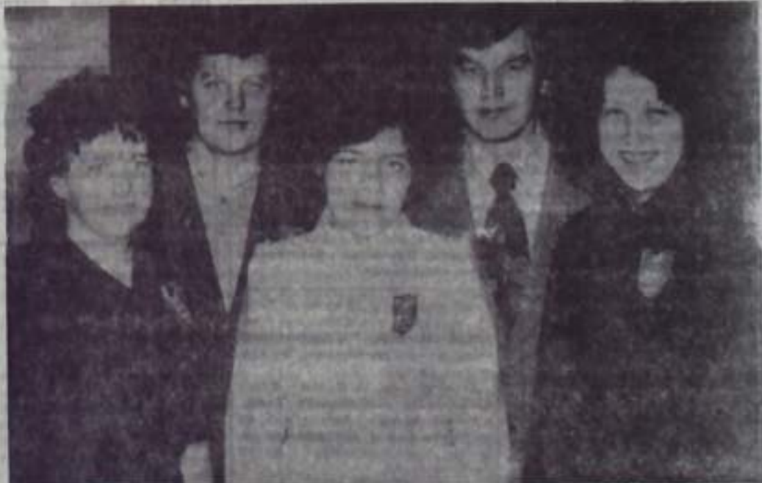
На снимке: делегаты комсомольской конференции — работники производственного объединения «Башкиртурголь».

«...Нас уже не может удовлетворить то, что абсолютное большинство советской молодежи с чувством высокой ответственности исполняет свой гражданский долг, глубоко понимает и активно претворит в жизнь политику партии. Наша задача — бороться за каждого молодого человека, за его убеждения, за его активную позицию в жизни — эти слова Л. Н. Брежнева являются основой действия и действия каждой комсомольской организации».