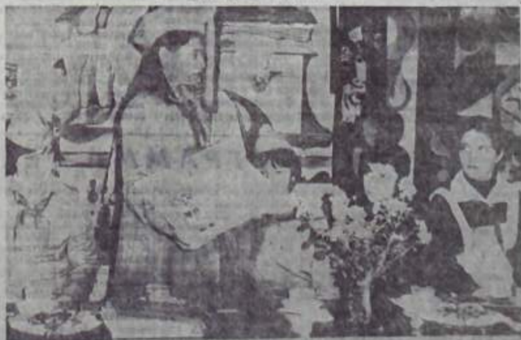
НА СНИМКЕ: юные друзья книги в центральной детской библиотеке.

Думается, не ради праздника любопытства среди других вопросов и гостей, прозвучал и такой: что вы цените в человеке? Доброту и жажду познания — такой ответ пришел по душе ребятам, эти качества им нравились, эти качества помогают им в учении, в общении с людьми и в той или иной борьбе и борьбе. Ведь, как показывает музей книги и материалы