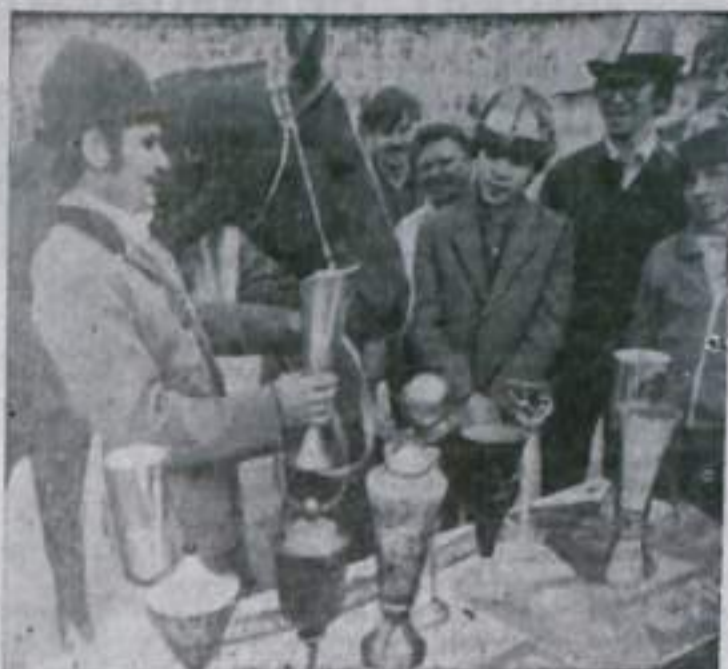
«Сосредоточить главное внимание на привлечении трудящихся, молодежи к занятиям физической культурой и спортом непосредственно на предприятиях, в колхозах, совхозах...»

(Из постановления ЦК КПСС и Совета Министров СССР).