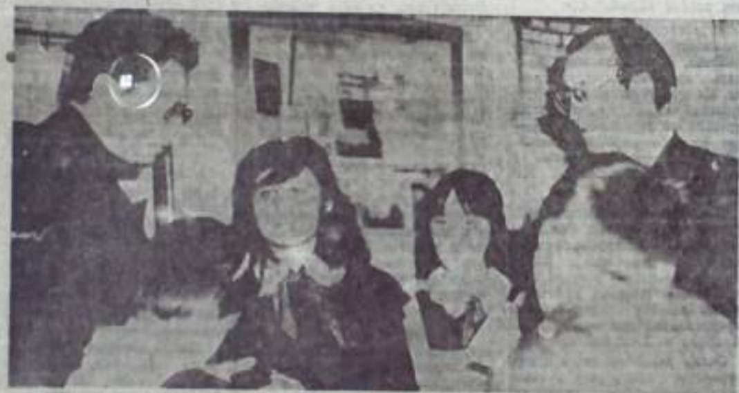
НА СНИМКЕ: в музее имени Пушкина. Слова — Л. Чубаров.

Так Пушкинводит нас в мир бесценного богатства, от его книг наши умы и сердца тянутся к книгам другим, жаждут новых встреч и открытий.