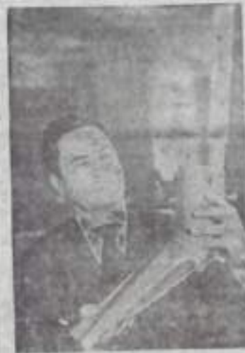
Уфа. Ученик Башкирского сельскохозяйственного институт...