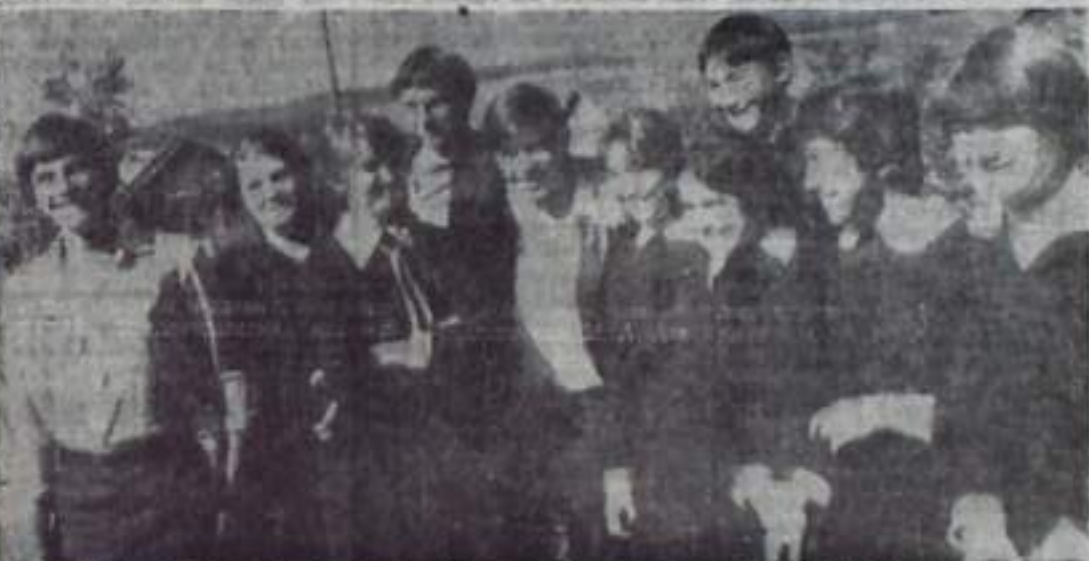
будет она по-советски прямой и честной, по-хозяйски трудолюбивой и ответственной. На снимке: учащиеся Бахмутской средней школы.

Кто-то останется в родном колхозе и станет трудиться на его благо, кто-то уедет искать судьбу в иные края. Но где бы, на какой земле ни пролегла их жизненная дорога, можно не сомневаться, что