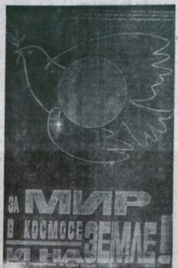
Около четырех тысяч работ более чем из пятидесяти стран были присланы на международный конкурс плакатов под девизом «За мир, гуманизм, против угрозы ядерной войны».

Заместитель председателя жюри международного конкурса плакатов, лауреат Международной Ленинской премии «За укрепление мира между народами», почетный член Академии художеств СССР, замечательный датский художник коммунист Херлуф Видструп сказал, что все участники конкурса в своем творчестве подчеркивают ведущую роль СССР в деле сохранения всеобщего мира, борьбе против угрозы войны, за равноправие, укрепление дружбы и взаимопонимания между народами земли.