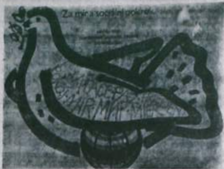
Репродукция В. ВЕЛИКОКАННИНА.

Дети клубы провели для участников конференции ярмарку солидарности, сбор подписей в защиту мира.