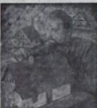
домов С. Лангелле.

На снимке: главный архитектор проекта новой серии