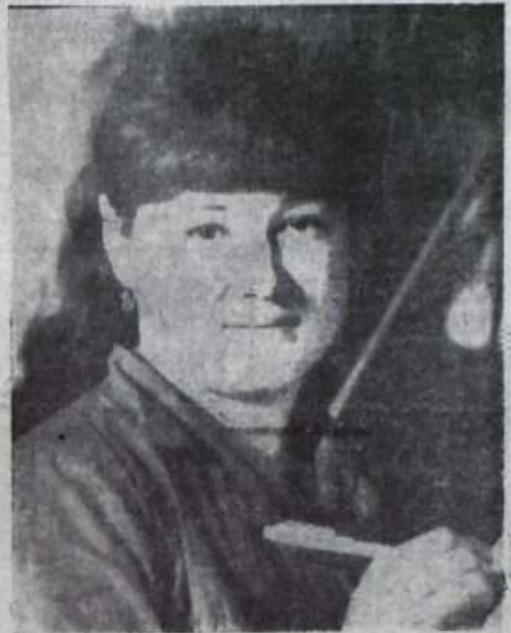
Портрет делегата ДЕПУТАТ, КОМСОРГ

Вот тот небольшой круг вопросов, которые мы должны будем обсудить на своей конференции. Конференция — не только своеобразный смотры сил, достижений, но и критическая оценка сделанному взгляд в будущее. О том какой разговор у нас получится судить делегатам. Им в свою очередь необходимо будет донести до каждого члена своей организации идеи и задачи, которые прозвучат на конференции.