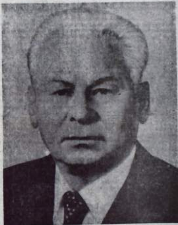
Генеральный секретарь ЦК КПСС Константин Устинович ЧЕРНЕНКО.

Затем на Пленуме выступил Генеральный секретарь ЦК КПСС товарищ К. У. Черненко. Он выразил сердечную благодарность за высокое доверие, оказанное ему Центральным Комитетом партии. Товарищ К. У. Черненко заявил Центральный Комитет КПСС, Коммунистическую партию, что приложит все свои силы, знания и жизненный опыт для успешного выполнения задач коммунистического строительства в нашей стране, обеспечения ответственности в решении поставленных XXVI съездом КПСС задач дальнейшего укрепления экономического и оборонного могущества СССР, благосостояния советского народа, укрепления мира, в осуществлении