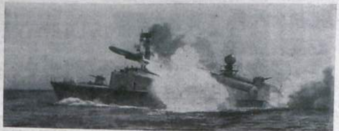
Пуск ракеты с ракетного катера.

едином строю с воинами других родов Вооруженных Сил надежно охраняют мирный созидательный труд своего народа и всегда готовы к защите неприкосновенности морских рубежей нашей Родины.