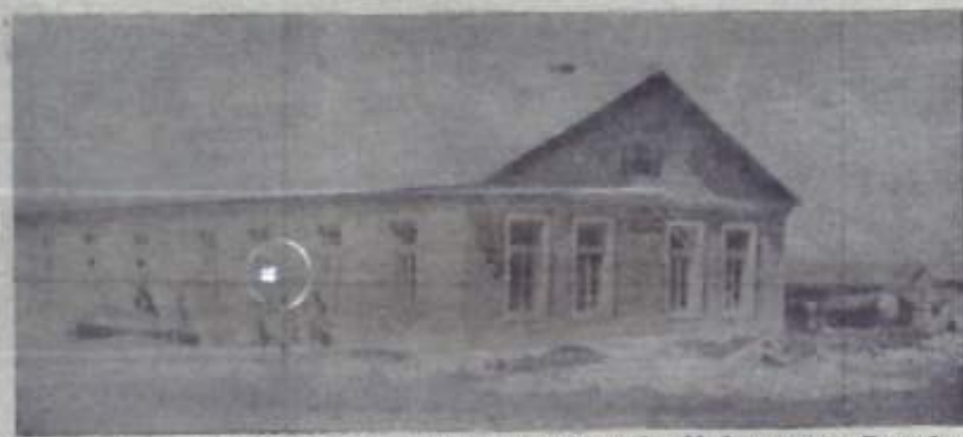
В этом здании разместятся дети колхозников бригады № 2 колхоза «Дружба».

— до 26, причем 21 объект ввести в строй к 50-й годовщине Октября, а 2 объекта — сверх задания.