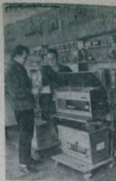
К 50-летию Великого Октября работники Курганской областной потребительской кооперации откроют 110 магазинов. Из них 88 будут построены на средства колхозов и совхозов. Большинство магазинов возводится по типовым проектам.

НА СНИМКЕ: в новом магазине «Новинка» села Шмаково Кетовского района.