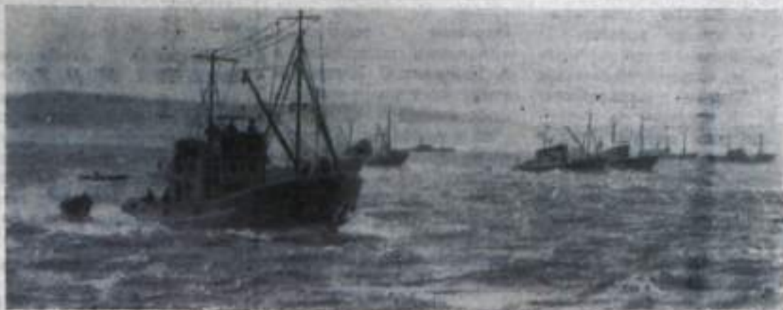
Колхозные сейнеры на путине в Черном море.