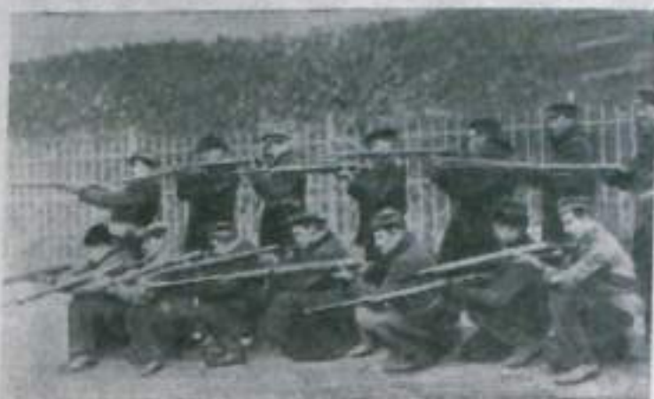
1917 год. Обучение отряда Красной гвардии у Смольного.

Партия большевиков, возглавляемая В. И. Лениным, привела народы нашей страны к победе Великой Октябрьской социалистической революции.