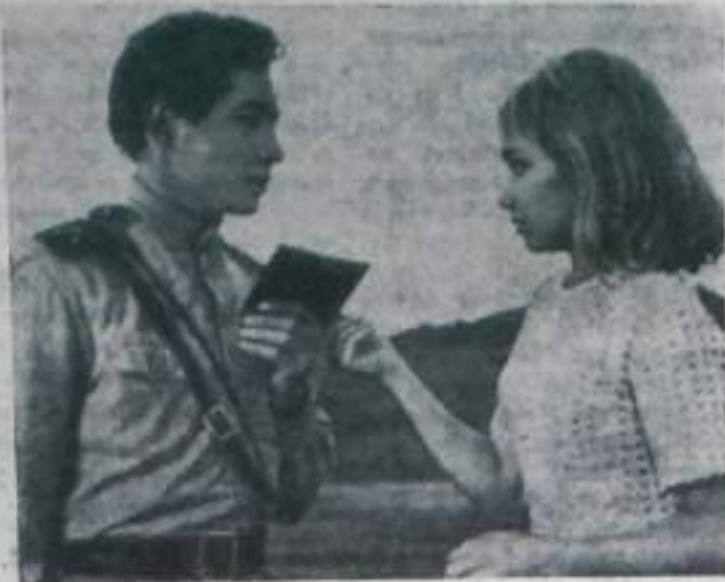
Кадр из нового художественного фильма «Зося»: Михаил (актер Юрий Каморный), Зося (польская актриса Пола Ранка). Фильм представлен на конкурс V международного кинофестиваля в Москве.

В создании этой картины, поставленной по одноимен-