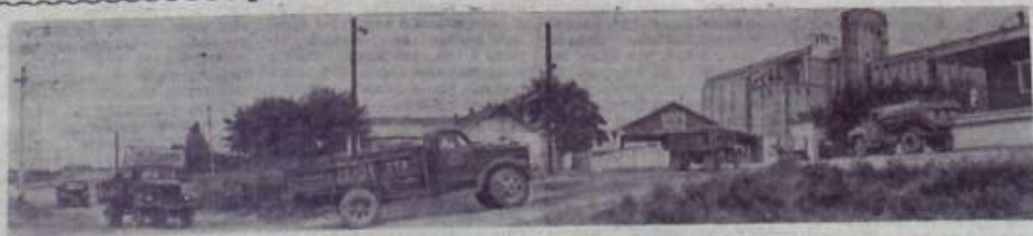
На Ставрополье в разгаре жатва колосовых, темпы ее нарастают с каждым днем. Инициаторы социалистического соревнования за уборку без потерь механизаторы колхоза имени Калинина Курского района не допускают большого разрыва между косовицей и обмолотом.

Слова президента о том, что Советский Союз поддерживает справедливую борьбу арабов, были встречены аплодисментами всего зала.