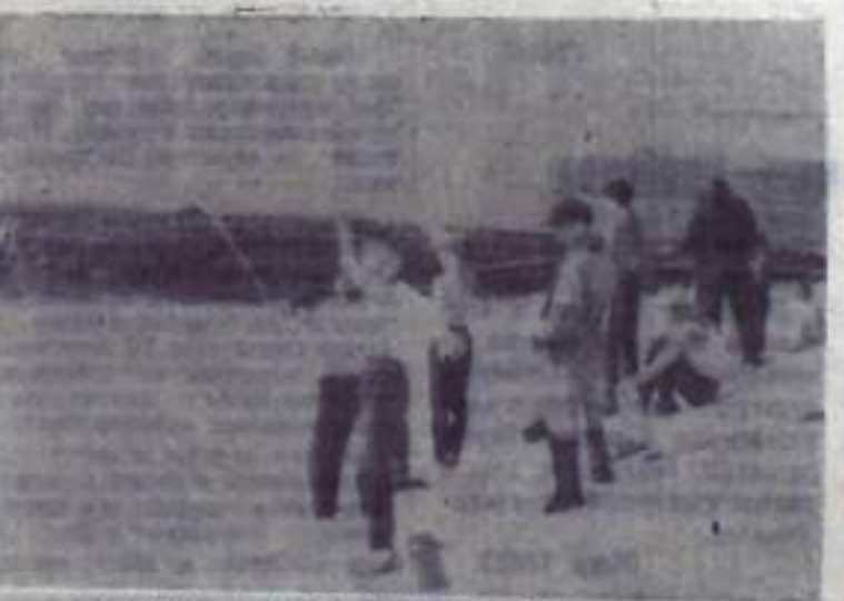
Прекрасна природа Нузуса. Здесь раскинулось на многие километры искусственное море, созданное кууртаускими строителями. Рыбы в нем много, водятся щука и окунь, голавль и подуст. Многих рыбаков-любителей, взрослых и юных, можно видеть с удочками на берегах водохранилища.