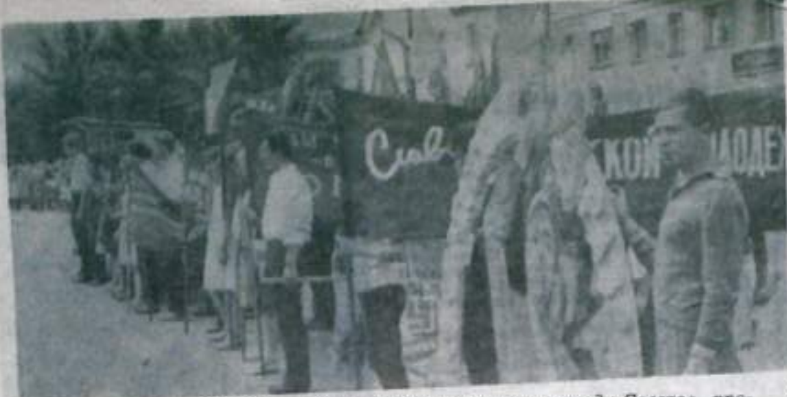
26 июля в Кумертау на площади Советов про- тодил торжественный митинг, посвященный Дню молодежи. На снимке запечатлена колонна уча- стников — городская и сельская молодежь.