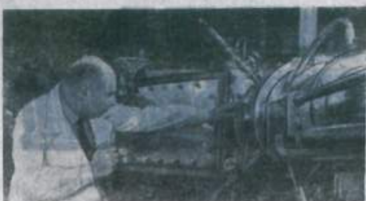
Флеров Г. Н., член-корреспондент Академии наук СССР, директор лаборатории Объединенного института ядерных исследований. Премия присуждена за участие в синтезе и исследовании свойств трансуранических элементов.