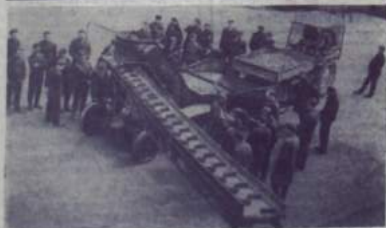
Эстонская ССР. Тартуский завод сельскохозяйственных машин «Выйт» приступил к изготовлению транспортеров-загрузчиков ТЗК-30, работающих при помощи электродвигателя. Машинки предназначены для погрузки картофеля, их производительность 30 тонн в час. В этом году завод изготовит 250 таких транспортеров. На снимке: опробование машины на заводском дворе.

ская нефтебаза должна выделять районным и потреббюджетам рыночные талоны на горюче-смазочные материалы. Через потреббюджет каждый владелец транспортных средств может приобрести талоны на горюче-смазочные материалы и производить заправку там же.