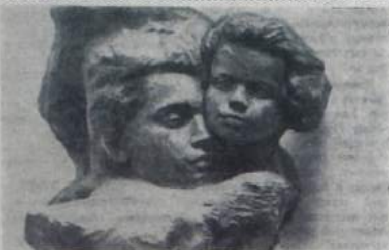
Москва В залах Академии художеств СССР открыта выставка работ студентов Московского художественного института имени В. И. Сурикова и Ленинградского института живописи, скульптуры и архитектуры имени И. Е. Репина. На снимке: скульптура студента 5-го курса А. Сысолова «Мать и дочь» (дерево). Фото Э. Евзерихина.