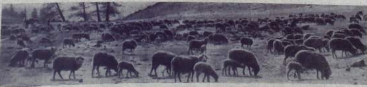
В колхозах и совхозах созданы крупные животноводческие фермы. НА СНИМКЕ: стая овец пятой фермы колхоза имени Карла Маркса на высокогорном пастбище (Алтайский край).

Индустрия помогает и плодородию земель. В дореволюционной России минеральные удобрения