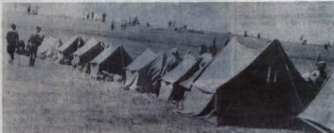
На снимках: 1. К месту слета (отряд школы №1); 2. Вручение грамот и призов; 3. Палаточный городок. Текст и фото Ю. ЛАРИНА.

Так прошел этот полезный и увлекательный слет.