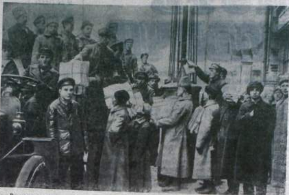
Раздача газет в первый день заседания Советов в Москве. (По материалам Центрального государственного архива кинофотофонодокументов СССР).