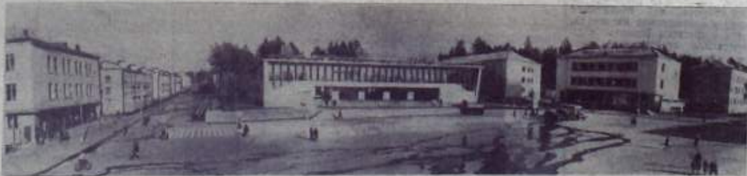
Вид на поселок Заречный.

СВЕРДЛОВСКАЯ ОБЛАСТЬ. На Белоярской атомной электростанции имени И. В. Курчатова скоро вступит в строй действующих второй энергоблок. Вместе со станцией строится поселок атомщиков — Заречный. В нем — уже десятки красивых многоэтажных жилых домов, бытовые и культурные учреждения.