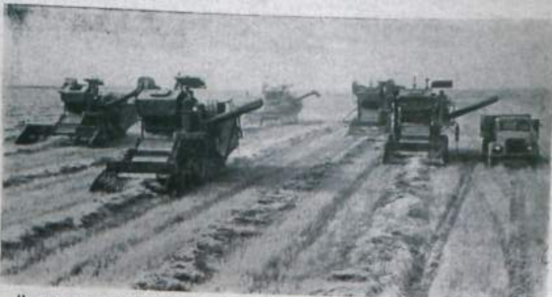
На широких просторах полей колхозов и совхозов работают самые современные машины.

Октябрь принес освобождение от вековой нужды, забитости и бесправия.