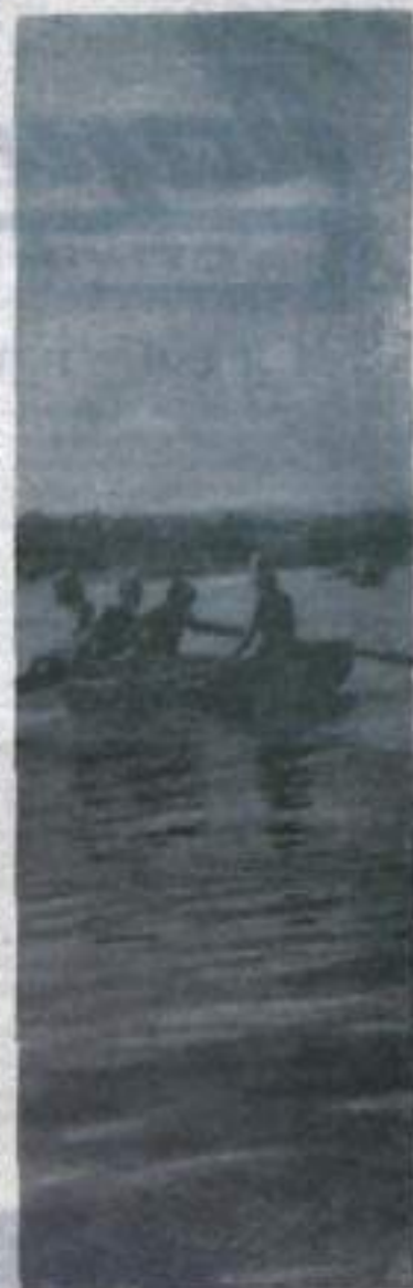
На реке.