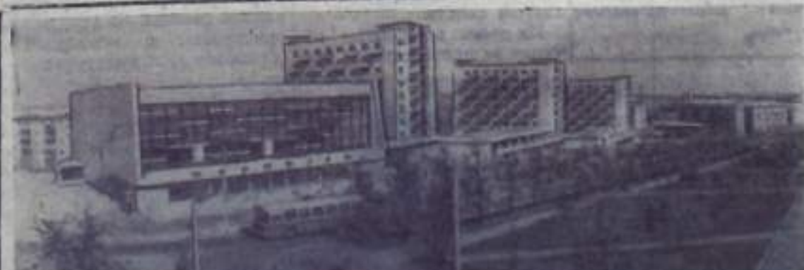
МИНСК. Один из новых районов города — улица имени Толбухина. Следи — самый крупный в городе кинотеатр «Партизаны».

Н. ОБЪЕДНОВА, секретарь городского отделения общества «Знание».