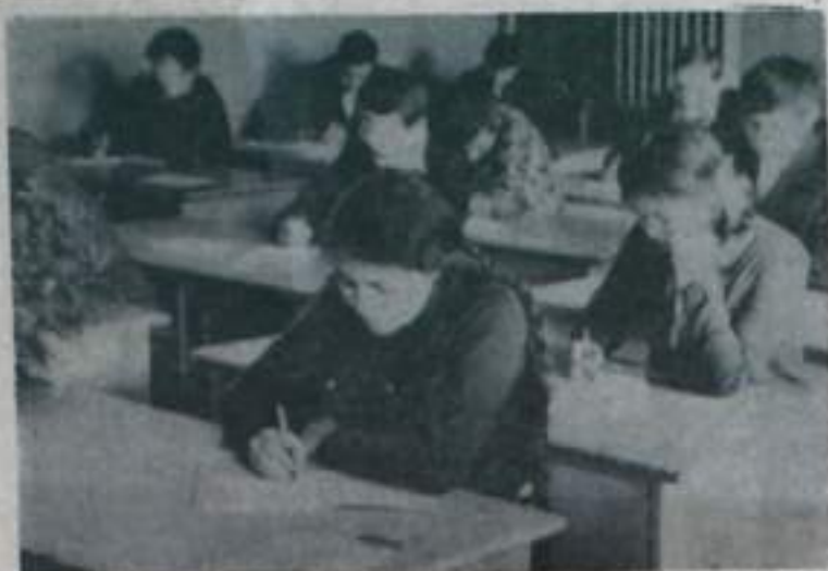
У десятиклассников идут экзамены. НА СНИМКЕ: в школе № 1 учащиеся-выпускники пишут сочинение.