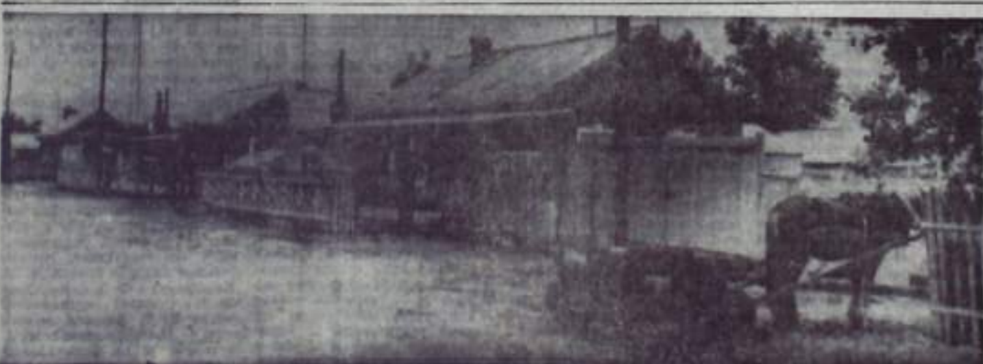
НОВАЯ УЛИЦА СЕЛА НОВО-МУРАПТАЛОВО

заведующая детсадом, депутат сельского Совета, отличник народного просвещения РСФСР.