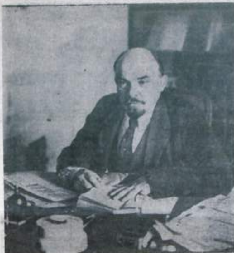
В. И. Ленин в своем кабинете в Кремле, Москва, октябрь 1918 года.

В. НЕСТЕРКИН, редактор стенной газеты «Брикетики».