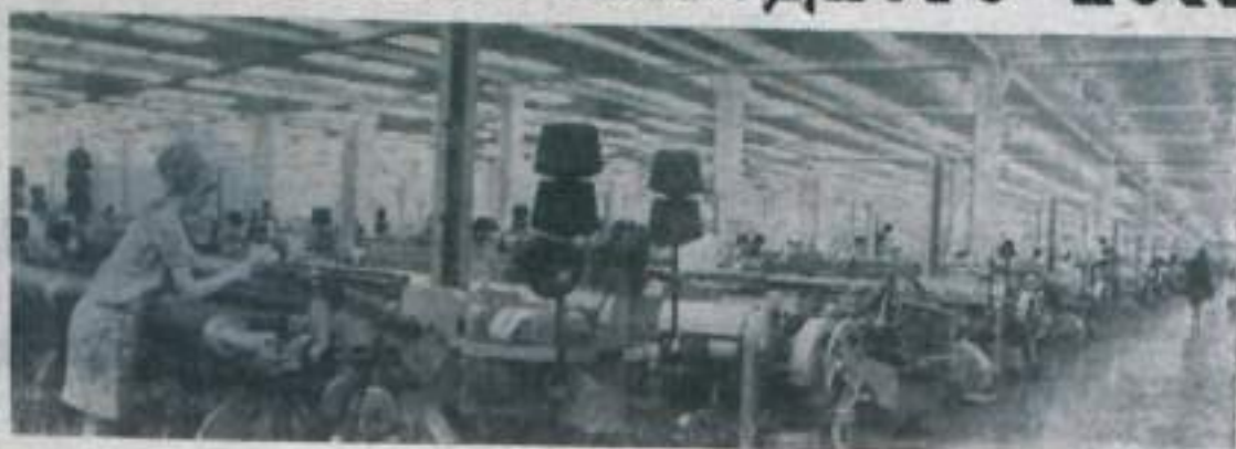
ИВАНОВО. Ткацкий цех камвольного комбината.

С такого низкого уровня первая страна социализма начала свою борьбу за повышение жизненного уровня народа.