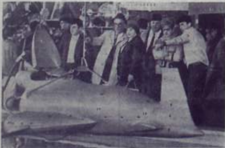
Советский навильон... в центре внимания многочисленных туристов, прибывших в канадский город Монреаль на Всемирную выставку «Экспо-67».

На снимке: в советском навильоне у батинлана «Атлант-1» (планера для подводных исследований в области техники промыслового рыболовства).