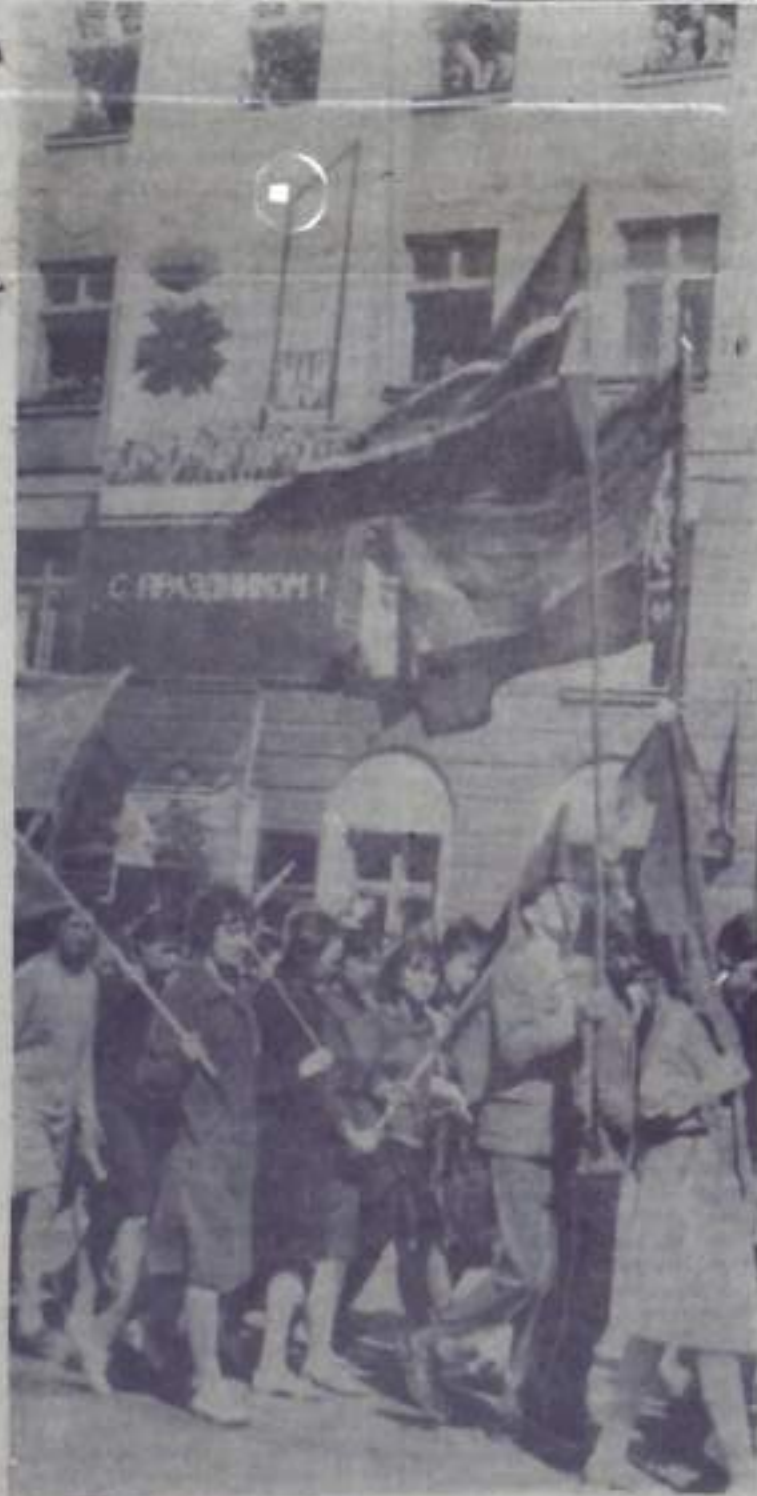
Празднование 1-го Мая в г. Кумертау.