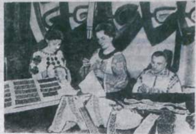
Искусные художественные изделия, выполненные народными умельцами из села Доя Кымпулунг-Молдовенеского района, славятся далеко за пределами Румынии, большим спросом пользуются они у покупателей и на внутреннем рынке.

На снимке: мастера художественной вышивки — члены кооператива кустарных изделий — в своей мастерской.