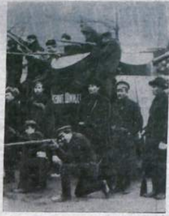
Петроград. Рабочие, отбившие у войск Керенского броненник «Лейтенант Шмидт». Октябрь 1917 года.