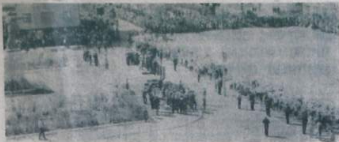
Первомайская демонстрация на Советской площади в г. Кумертау.