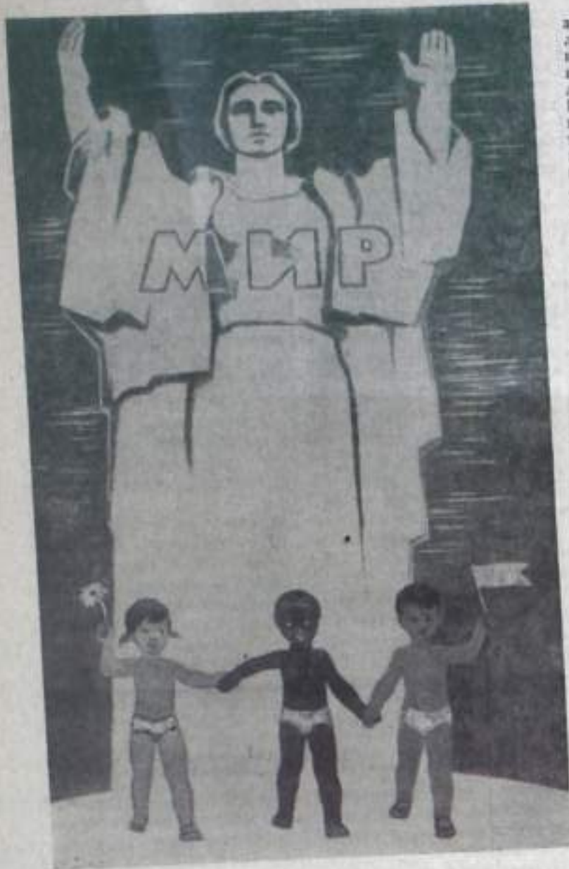
Для нас, надежда будущего, — дети, Пусть будет вечно

Плакаты художника Е. Скрынникова. Стихи А. Филатова.