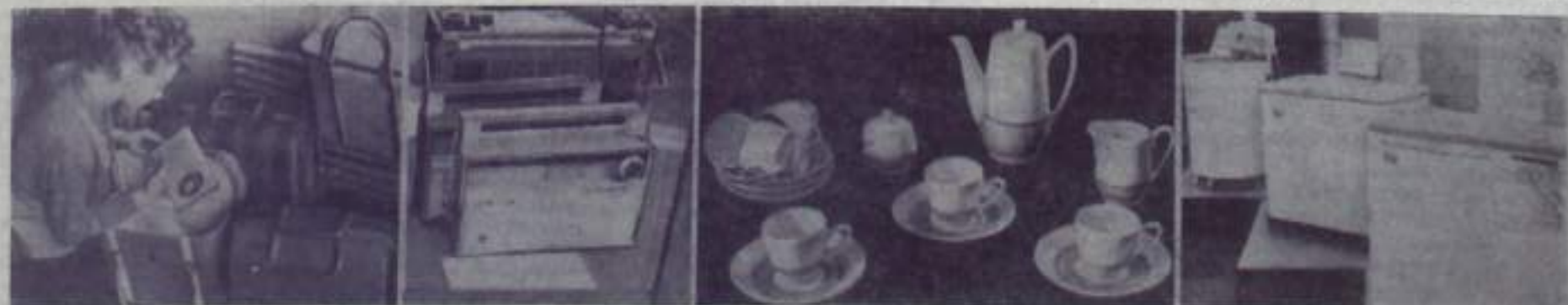
Почти 6 тысяч образцов новых товаров народного потребления внедряются в производство в юбилейном, 1967 году. На снимках (слева направо): сумка-холодильник (выпускается в Горьковской области), переносный радиоприемник «Меридиан» (Киев), кофейный термос (Ереван), стиральные машины (Киев, Москва).