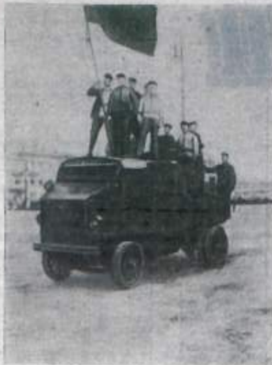
Красногвардейцы на Красной площади в Москве. 1917 год.