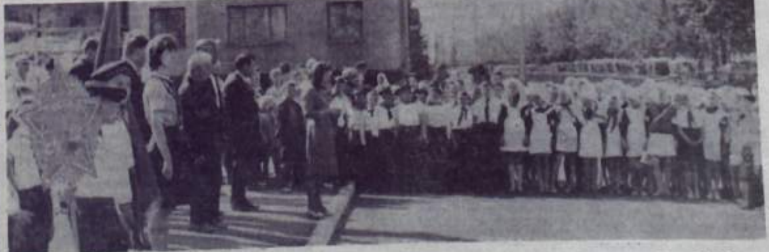
Площадь Советов в Кумертау. Идет Всесоюзная пионерская радиочайка, посвященная Дню Победы.

Завершением этой недели явился митинг молодежи Киева, который состоялся 9 мая на крутом берегу Днепра, где в парке Вечной Славы высится обелиск на могиле неизвестного солдата.