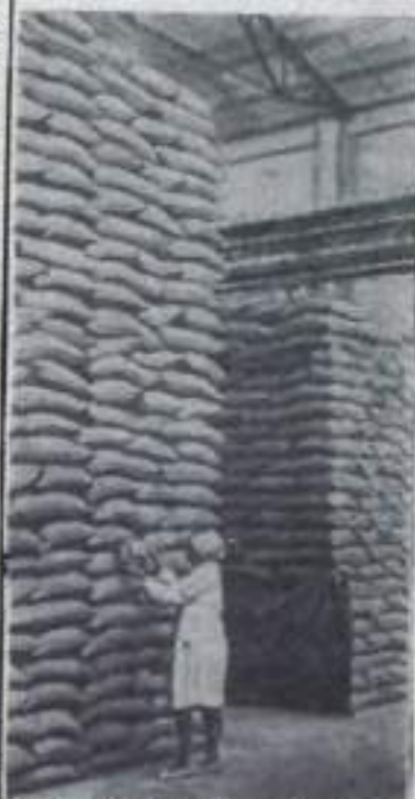
КРАСНОДАРСКИЙ КРАЙ. На складе Тимшевского сахарного завода.

Говоря о новой продукции текстильщиков, следует, например, упомянуть о «форизе» — ткани, пропитанной специальным составом. Брюки из такого материала не нужно гладить.