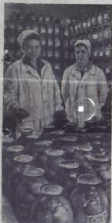
МЦЕНСК. Консервный завод. Здесь вырабатывают более 50 видов овощных и фруктовых консервов.

Не лучше было положение и с продукцией пищевой промышленности — сахаром, кондитерскими изделиями, консервами и т. д.