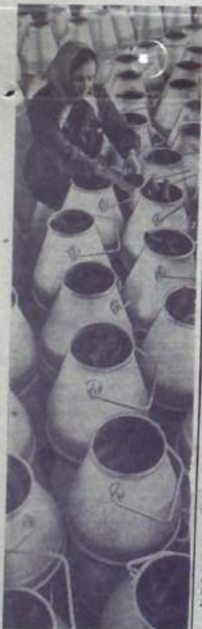
Каждые два из трех выпускаемых в СССР дизельных агрегатов изготавливаются в небольшом латвийском городе Резекне.