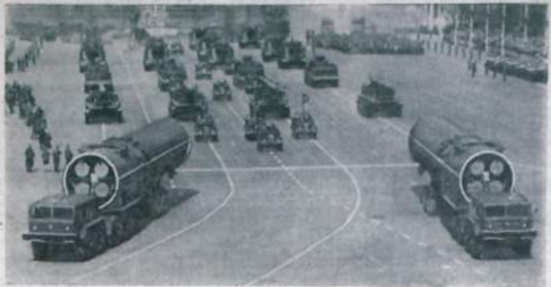
Празднование 1-го Мая в Москве.

машинисты, работники автоколонны № 1518, идут представители учреждений и предприятий города. На транспарантах, которые они несут, выражено стремление ознаменовать славное пятидесятилетие Советской власти новыми достижениями в труде. Рапортуют о своих трудовых победах, трудящиеся нашего города высоко несут портреты руководителей партии и правительства, лозунги и призывы, зовущие всех людей земного шара жить в мире и дружбе, сказать войне грозное — нет!