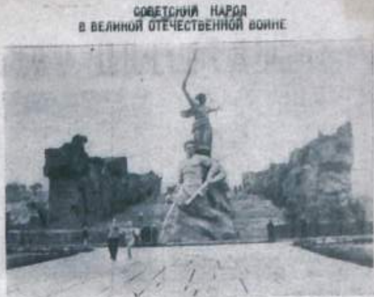
ВОЛГОГРАД. Памятник-монумент героям Сталинградской битвы на Мамаевом кургане. Авторы ансамбля — народный художник СССР Е. Вучетич и архитектор Я. Белопольский.

Счастливого Вам пути, под голубым безоблачным небом, по мирным дорогам, Иван Ильич! Ю. БОЛЬШАГИН.