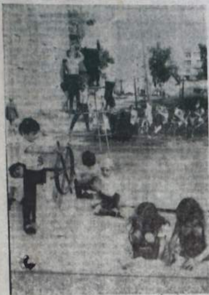
Шефы общинки № 5 объединения «Башкир-уголь» — комитетом РМЗ и автотракторного хозяйства — с большой заботой относятся к выполнению своего общественного долга. Недавно они подарили для маленьких жильцов общинки детскую площадку. Здесь для юных романтиков в расклеванный корабль