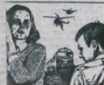
ПОЕЗД ВНЕ РАСПИСАНИЯ