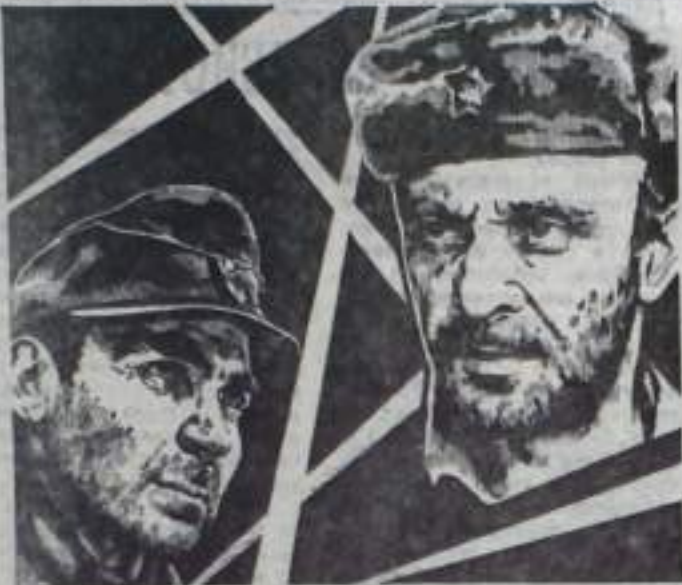
ПРОВЕРКА НА ДОРОГАХ

Смотрите на экранах города РЕПЕРТУАР ИЮНЯ