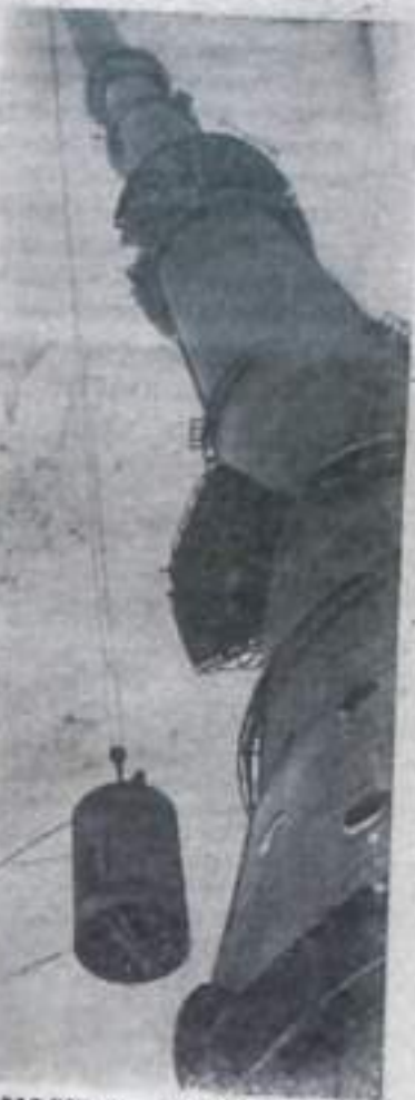
МОСКВА. Монтажные Останкинской телевизионной башни произвели подъем первой 23-тонной секции, являющейся основанием металлической антенны, которой увенчается высочайшая башня мира. Поднята также вторая секция. После подъема остальных частей антенны высота телебашни достигнет 533 метров.

НА СНИМКЕ: подъем секции.