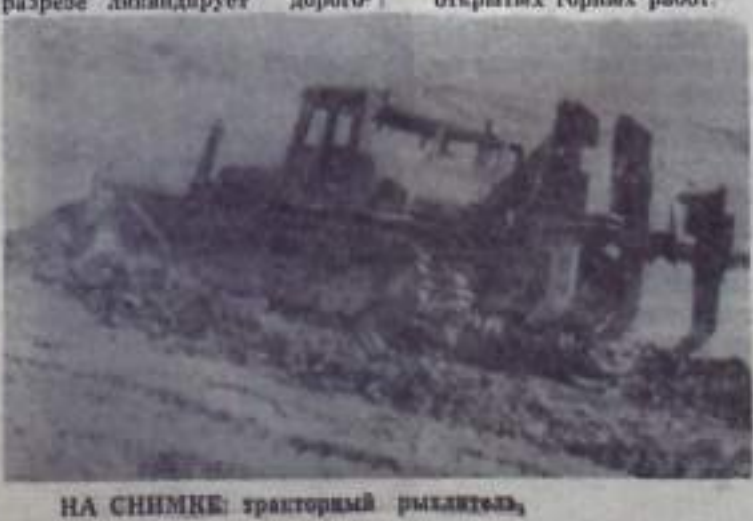
НА СНИМКЕ: тракторный рылитель.

стоящие буровзрывные работы, простоя экскаваторов и электровозов во время взрывных работ, устранил ручной труд при зарежании и взрывании скважин, улучшит условия труда. Только за счет сокращения прямых затрат, связанных с рыллением мерзлых пород и углей, Кузнецкий разрез получит за год 40 тысяч рублей экономии. Если учесть еще расходы, связанные с выжиданными простоями экскаваторов и электровозов при ежедневном производстве взрывных работ, планирование угла после взрыва, работ по восстановлению линий связи и других расходов, то реальная экономия от применения рылителя может быть еще больше. Рылитель Д-652А готовится к серийному выпуску. Горняки Кузнецкого разреза имеют реальную возможность получить эту машину в наступающем юбилейном году. Это будет первый опыт промышленного внедрения рылителей в угольной промышленности. На ЧТЗ ведется сборка 500-сильного трактора с рыллителем, который будет сразу рыллить слой на глубину 1,5 метра. Он будет готов к 1 мая. Е. МАКЕЕВ, старший научный сотрудник Челябинского института открытых горных работ.