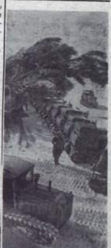
Сто тысяч тракторов поставили на линию готовности механизаторы Казахстана.

Хорошо подготовились к весне и в Боровском совхозе Кустанайской области. Здесь досрочно закончили ремонт тракторов, привели в готовность весь прицепной инвентарь. В этом году ремонтная база совхоза пополнилась специальными комбайновыми делами и автогаражом, а тракторный парк — мощными «Кировцами».