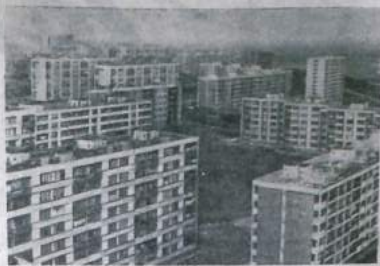
Сто пятьдесят тысяч квартир будет построено в течение пяти лет в Народной Республике Болгарии. Благоустроенные многоэтажные дома вырастают там, где совсем недавно были пустыри, или стояли покосившиеся хижины.

На снимке: новый квартал «Толбухин» в Бургасе.