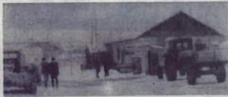
На снимке: у ворот молокозавода.

ректором. Она должна являться документом по контролю за расходованием средств на ремонт трактора. Здесь же дефектная ведомость превращена в заборную. Детали отпускаются в процессе ремонта по запискам контролера. Заполняет ее сам заведующий складом, а затем в нее детали, значащиеся в записках. Такой порядок не дает возможности заранее знать во что обойдется ремонт и ставит дирекцию после окончания ремонта перед совершившимся фактом. Ясно, что это не способствует борьбе за экономии, за снижение затрат на содержание техники.