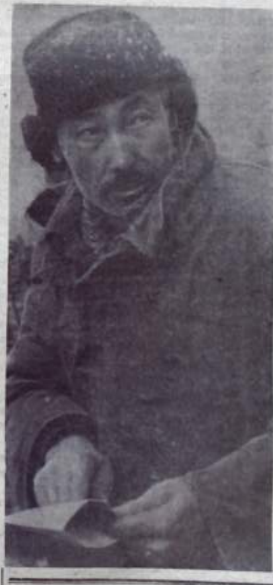
«ПУТЬ ИЛЬИЧА» 3 стр. 17 марта 1967 года.