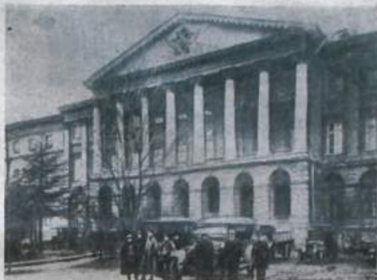
Петроград. Смольный. Октябрь 1917 г. (Снимок из архива кино-фото-фонодокументов в Ленинграде). Фотозвоника ТАСС.