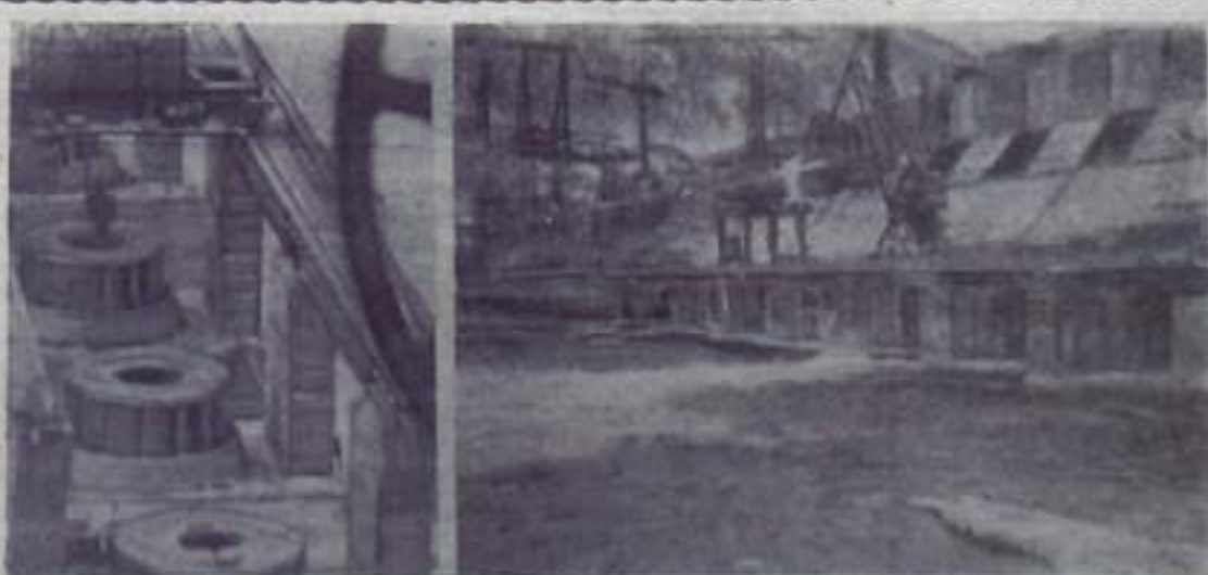
ДИВНОГОРСК. Строители Красноярской ГЭС прилагают все усилия для того, чтобы электростанция дала ток и юбилею Октября. На строительстве началось выполнение водохранилища. К моменту пуска первых агрегатов в нем накопится 18 миллиардов кубометров енисейской воды.

Городской Совет одобрил народнохозяйственный план г. Кумертау на 1967 год и утвердил представленный на рассмотрение бюджет на 1967 год по доходам и расходам в сумме 3764,5 тысячи рублей.