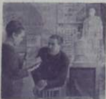
Донецкая область. Настоящим штабом политической и партийной учебы стал кабинет политпросвещения шахтоуправления «Холодная балка»

Однако делают комсомольцы-брикетчики не все возможное. Мало, всего 10 тонн, слано металлолома, не все еще комсомольцы имеют общественные поручения и не все инициативы добровольно выполняют их.