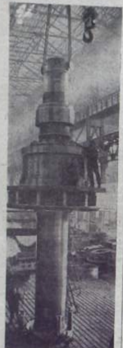
СВЕРДЛОВСК. На многих электростанциях нашей Родины и за ее пределами работают гидрогенераторы завода Уралэлектротяжмаш имени В. И. Ленина. Миллиарды киловатт электроэнергии выработано ими для народного хозяйства. Сейчас на заводе закончена сборка трех крупных машин для Саратовской ГЭС.