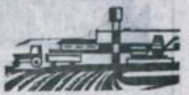
ПОДГОТОВКА СЕМЯН зерновых культур и посеивки сева по состоянию на 1 марта (в процентах).

Много третьеклассных семян осы в колхозе «Дружба», Кумертауском совхозе, колхозе «Путь к коммунизму», имени — в Кумертауском и Кызылшарском совхозах. Как показывает приведенная выше сводка, предстоит поработать с семенами таких агрономических служб: Кызылшарского и Муртауловского совхозов. Задача агрономов заключает-