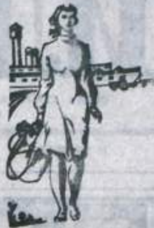
Тал, ильич: члены Колхоза Шафат в минувшем году сдала первого сорта молока свыше 90 процентов.

Внедрена лаухменная работа. Оплата труда дойной составляется в зависимости от количества, жирности и сортности молока. Животноводы комплекса работают по коллективному подходу. Применяется центрирование молока. Но здесь надо отметить, что на комплексе слабо организована работа по улучшению качественных показателей продукции. Много еще несоответствия молока и того, что не налажено его охлаждение. Нередки случаи, когда Мелеуловский молокозавод нарушает регулярность и вывозе с комплекса продукция не является нужной помощи хозяйства в вопросе холодильной установки. Кувертауский молокозавод в минувшем году молока «Путь к коммунизму» сдал молока первым сортом только 68,9 процента при среднем показателе по району 79 процентов. Свыше 8 процентов пришлось на долю не сортовой продукции. Такое положение не может быть терпимым дальше. В районе есть пример позитивный, что добиваться высокого качества продукции можно, если заниматься этим лучше.