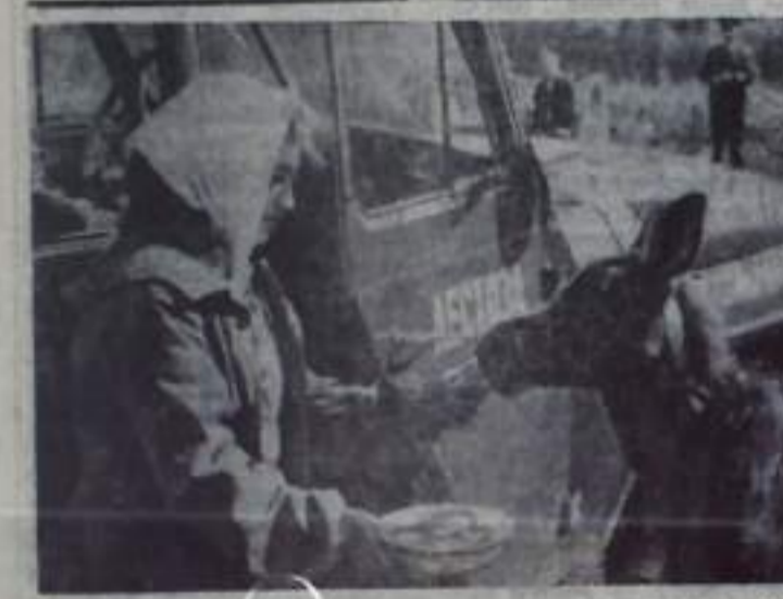
Башкирская АССР. В Бураевском лесохозяйственном хозяйстве создана необходимая лесная ферма. Судьбы «приписанных» и вей диких животных схожи.

Рига, в ее пределах охватывающая архитектурных памятников разных стилей и направлений.