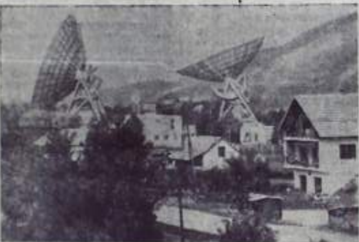
Редактор Э. Ю. ТАГИРОВ.