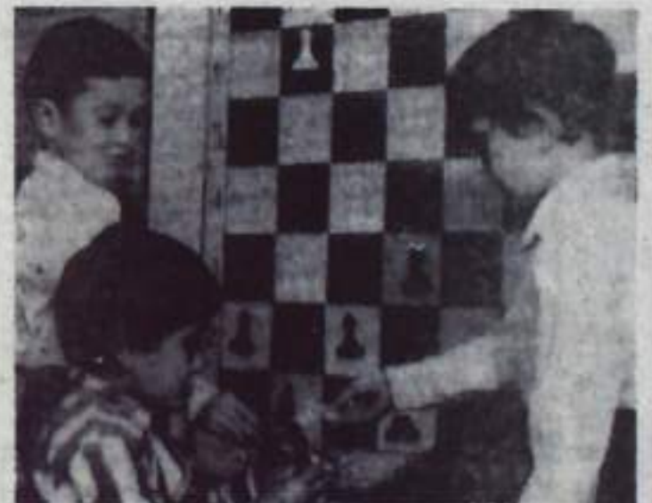
Замечательным нововведением в детском саду «Росинка» № 21 является магнитная шахматная доска. С удовольствием играют здесь ребята, имеющие хотя бы минимальные шахматные навыки.

С. НИКИТИНА, Т. БОРИСЮК преподаватели музыкальной школы.