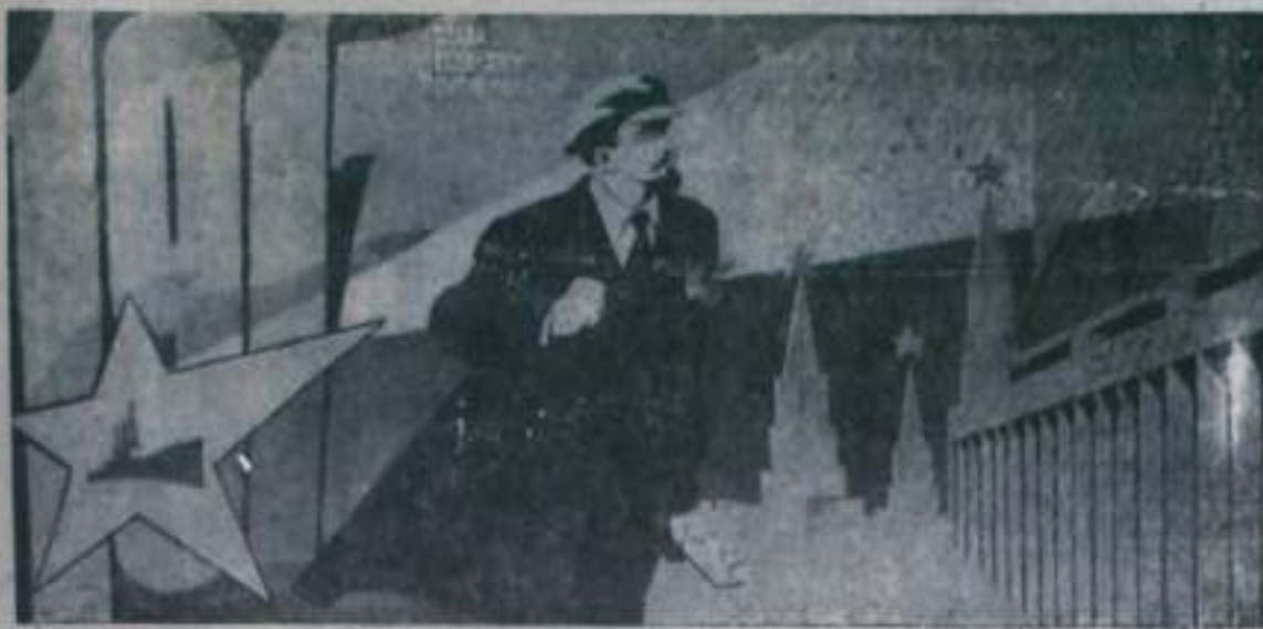
Плакат художника В. Сачнова «Слава Великому Октябрю!»