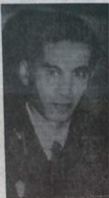
В любом деле трудно сделать первые шаги, тем более в таком сложном.