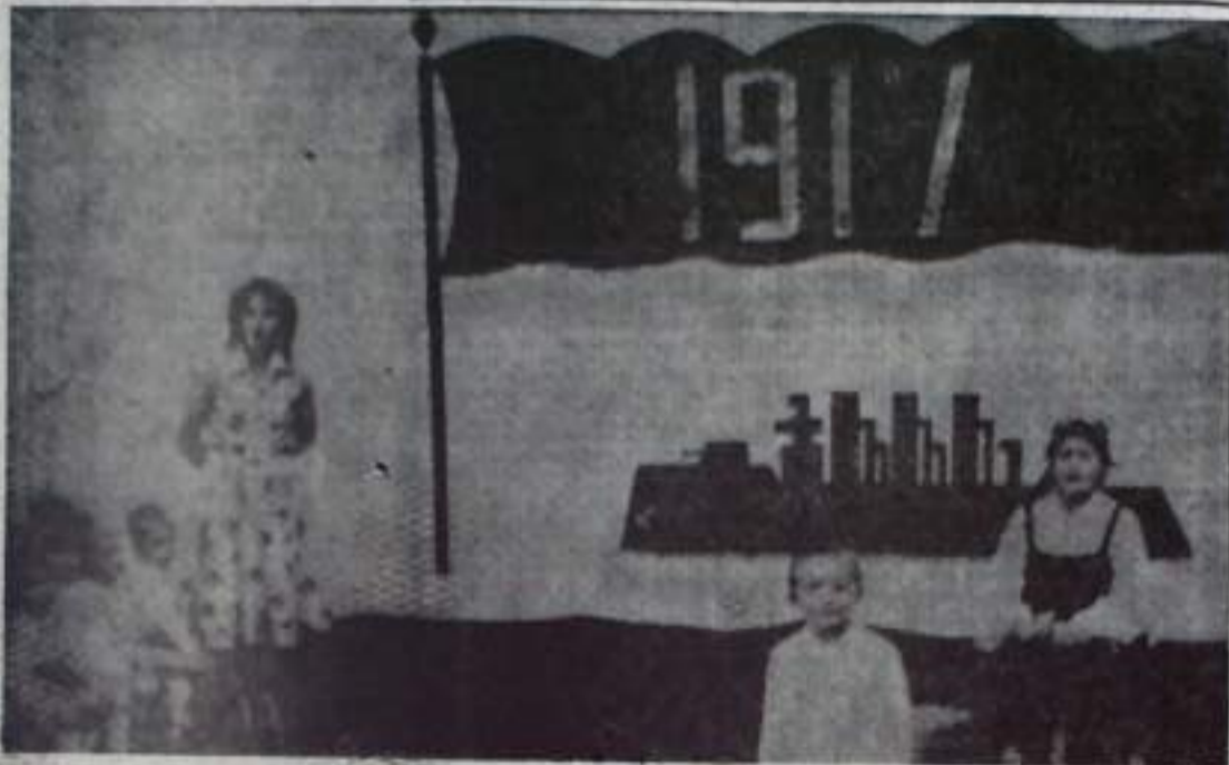
Отчет счастливому детству советской детворы дан в далеком семнадцатом году. И едва научившись говорить, наши малыши уже читают