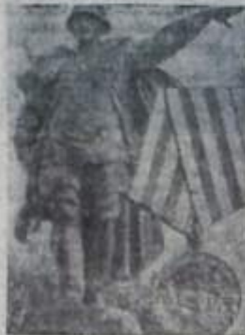
Он не продрать оборону ему так и не удалось.

Одни за другим в ожесточенном бою войны выжили из строя. Тяжелораненый полторух со связкой гранат бросился под фашистский танк и взорвал его. Враг потерял десятки солдат, много техни-