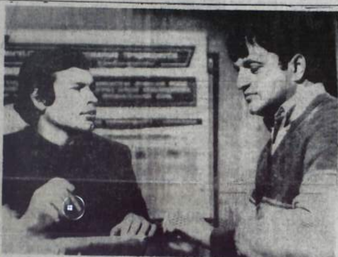
Объединение «Башкируголь»: ритм работы